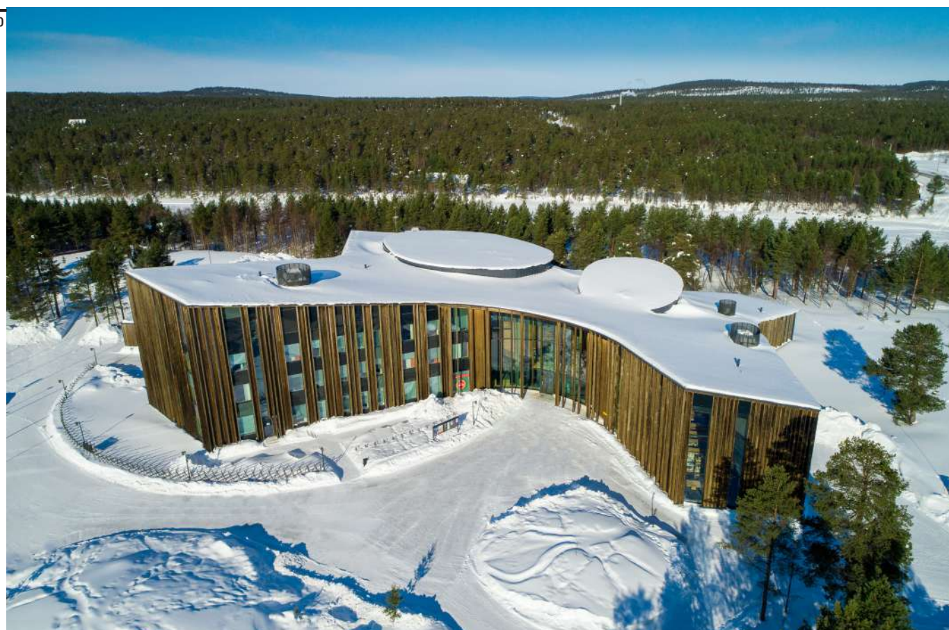
Fig. 11 Henning Larsen Architects, Nuovo municipio di Kiruna, Svezia, 2018 (Foto Henning Larsen Architects).