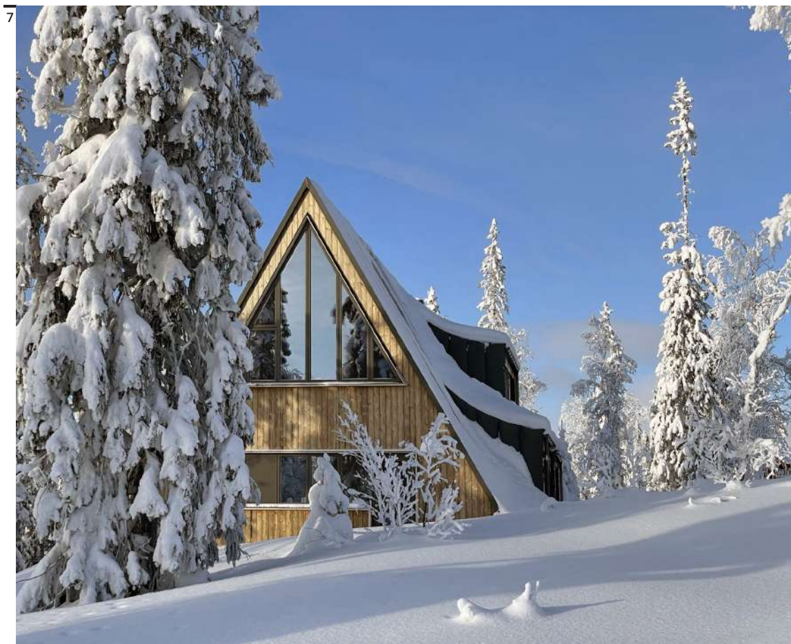
Figg. 6-7 Måns Tham Arkitektkontor, A-frame ski lodge, Edsåsdalen, Svezia, 2021.