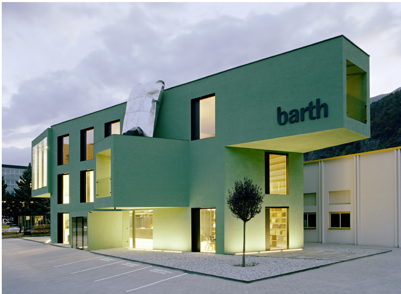
Fig. 3 Uffici Barth, Bressanone, Alto Adige, Bergmeisterwolf + Christian Schwienbacher, 2008 (foto Jürgen Eheim, Hurnaus Hertha).