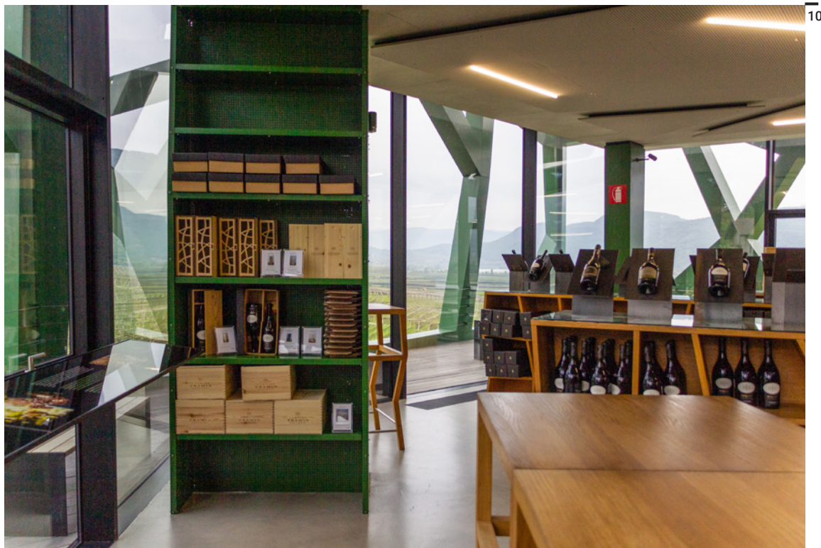
Fig. 9 Kellerei Tramin, Termeno, Alto Adige, Werner Tscholl, 2010.