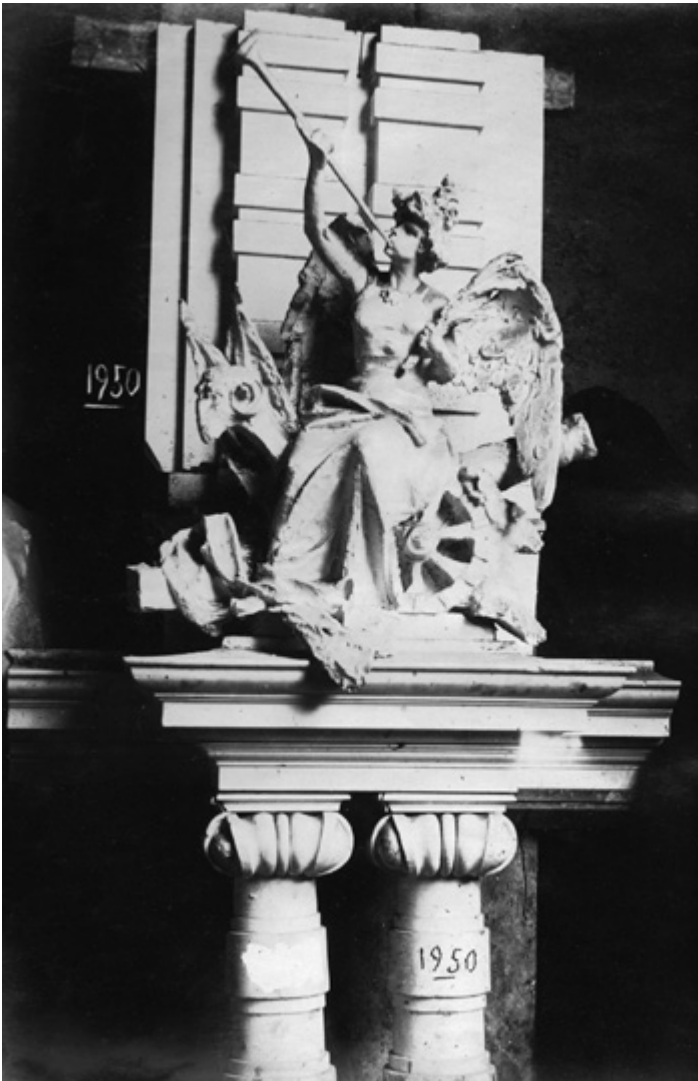
Fig. 1. Ditta Fratelli Musso e Papotti Francesco, Modello per la statua dell'Artiglieria da collocarsi sul portale del Regio Arsenale a Torino [1888]. PoliTo, DIST-APRi, Fondo Carlo Musso, MC. 85.

7 Schedatura condotta da Laura Guardamagna e Margherita Sassone.