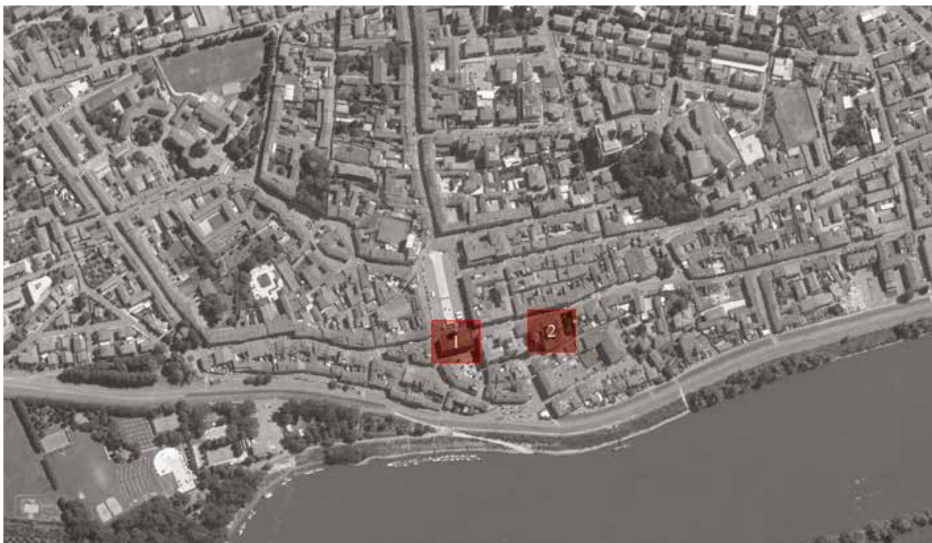
2. Casalmaggiore. Localizzazione dell'attuale palazzo comunale (n. 1) e del vecchio palazzo pubblico e antico teatro (n. 2).

La soluzione di Voghera, presentata intorno al 1829, manteneva l'impostazione planimetrica di Mones 6 . Per la facciata sulla piazza principale, il progettista proponeva due soluzioni: la più articolata [Fig. 3] era suddivisa in tre parti, di cui quella centrale era caratterizzata da quattro colonne di ordine corinzio gigante, mentre le terminazioni laterali presentavano lesene del medesimo tipo. Una ricca trabeazione coronava l'intero edificio e al centro era sormontata dal frontone e da un attico, che facevano da base alla torre campanaria, impostata su una pianta ottagonale. L'intera facciata era arricchita da sculture che rappresentavano i simboli dell'amministrazione civica e quelli di Casalmaggiore.