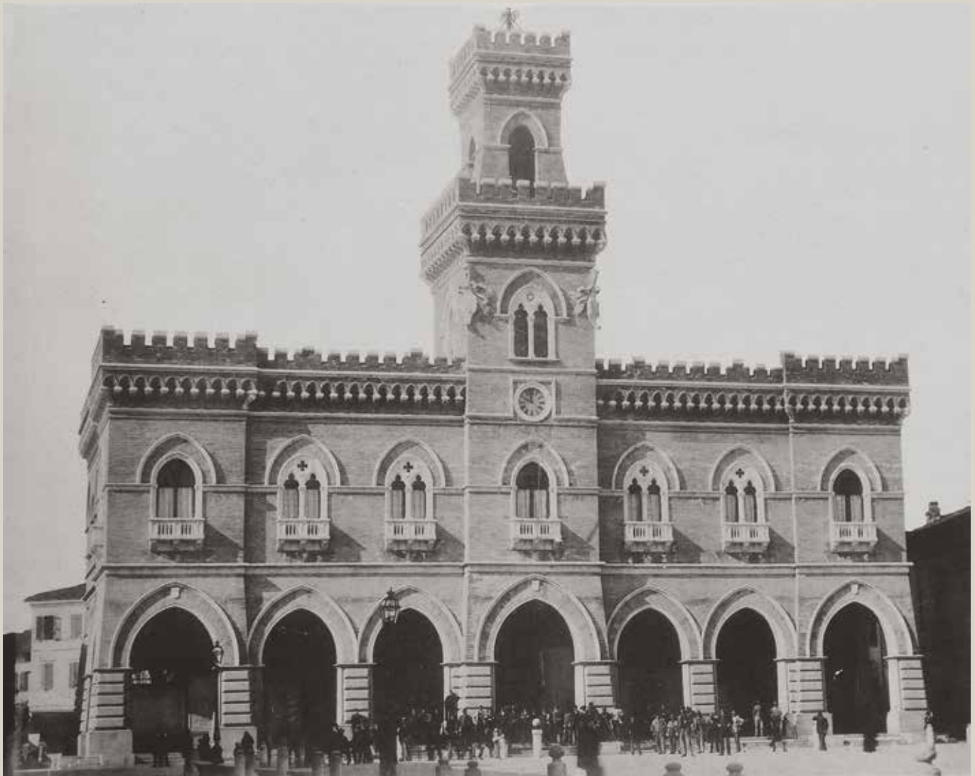
1. Casalmaggiore. Palazzo comunale: la facciata (Giacomo Misuraca, "Il nuovo Palazzo Municipale di Casalmaggiore", L'Edilizia Moderna. Periodico mensile di architettura pratica e costruzione , fasc. VII, luglio 1898, tav. XXX).