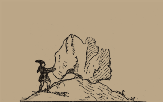
Pietra ballerina di Nuoro. A. La Marmora, Voyage en Sardaigne.