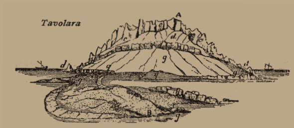
Veduta dell'isola di Tavolara. A. La Marmora, Voyage en Sardaigne.