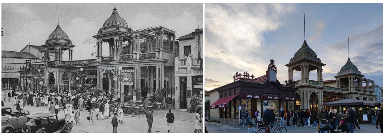
6: Caffè Margherita a Viareggio, cartolina di fine Ottocento e fotografia odierna.

Villa Costanza a Forte dei Marmi, di proprietà degli Agnelli dagli anni Venti, appariva isolata e circondata da vigneti. Oggi è l'hotel Augustus, uno dei più lussuosi e conosciuti alberghi italiani a livello internazionale, immerso in un contesto urbano densamente edificato e la cui connessione percettiva con il mare è negata.