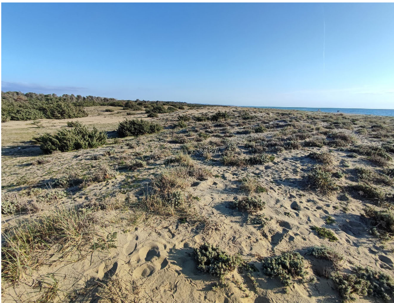
7: Permanenze di macchia mediterranea, dune e leccio a Viareggio, fotografia di A. Panicco.

si estesero al punto di formare un fronte edilizio unico e poco visivamente permeabile che suddivide la spiaggia dalle città.