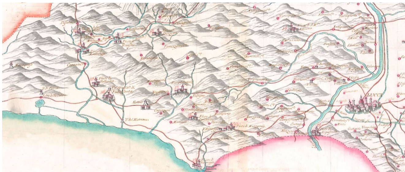
3: A., F. e L. Giachi, Diogesi di Lucca , seconda metà del XVIII secolo. Archivio di Stato di Firenze, Miscellanea di Pianta, Carte topografiche delle Diocesi della Toscana , 774, 774.d, dettaglio.