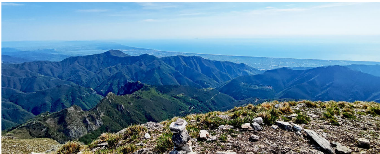
1: Panorama della Versilia dalle Alpi Apuane, fotografia di A. Panicco.

marittime. Qui si ritrovano la maggior parte degli insediamenti, che hanno determinato importanti elementi pianificatori del territorio attraverso lo sviluppo della rete viaria a partire dagli assi storici in fasce parallele alla costa e su differenti altimetrie, i cui collegamenti trasversali si rifanno all'assetto idrografico. Da tale impronta si sono formati i paesaggi rurali, caratterizzati da ampi appezzamenti coltivati e frammentati da ristrette aree a bosco. L'area montana si connota invece per un paesaggio di tipo forestale, in cui si ritrovano i castagneti, le faggete e i boschi di latifoglie, mentre nelle zone sommitali si riconoscono le praterie, gli ambienti rupestri e le torbiere. I fronti cava collocati sui versanti delle Apuane hanno inoltre rimodellato il profilo montuoso, modificandone le caratteristiche orogenetiche originarie 1 .