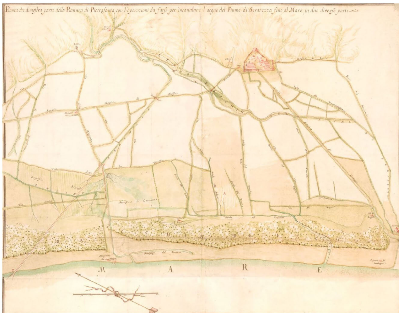
4: Pianta che dimostra parte della Pianura di Pietrasanta, con l'operazioni da farsi per incanalare l'acque del fiume di Seravezza fino al mare, in due diverse parti, 1650-1700. Archivio di Stato di Firenze, Pianta dei Capitani di Parte Guelfa, Cartoni, Cartone XX, 20, n. 17.

Alle zone paludose si susseguono alcuni territori rappresentati tramite differente cromatura, probabilmente per identificare le aree agricole, segnati dal passaggio delle vie di comunicazione, dai fossi e dai canali utili agli scopi produttivi e al defluire delle acque. Sullo sfondo infine è presente la raffigurazione del centro urbano di Pietrasanta in cui sono evidenziati i principali edifici e gli assi urbani (fig. 4).