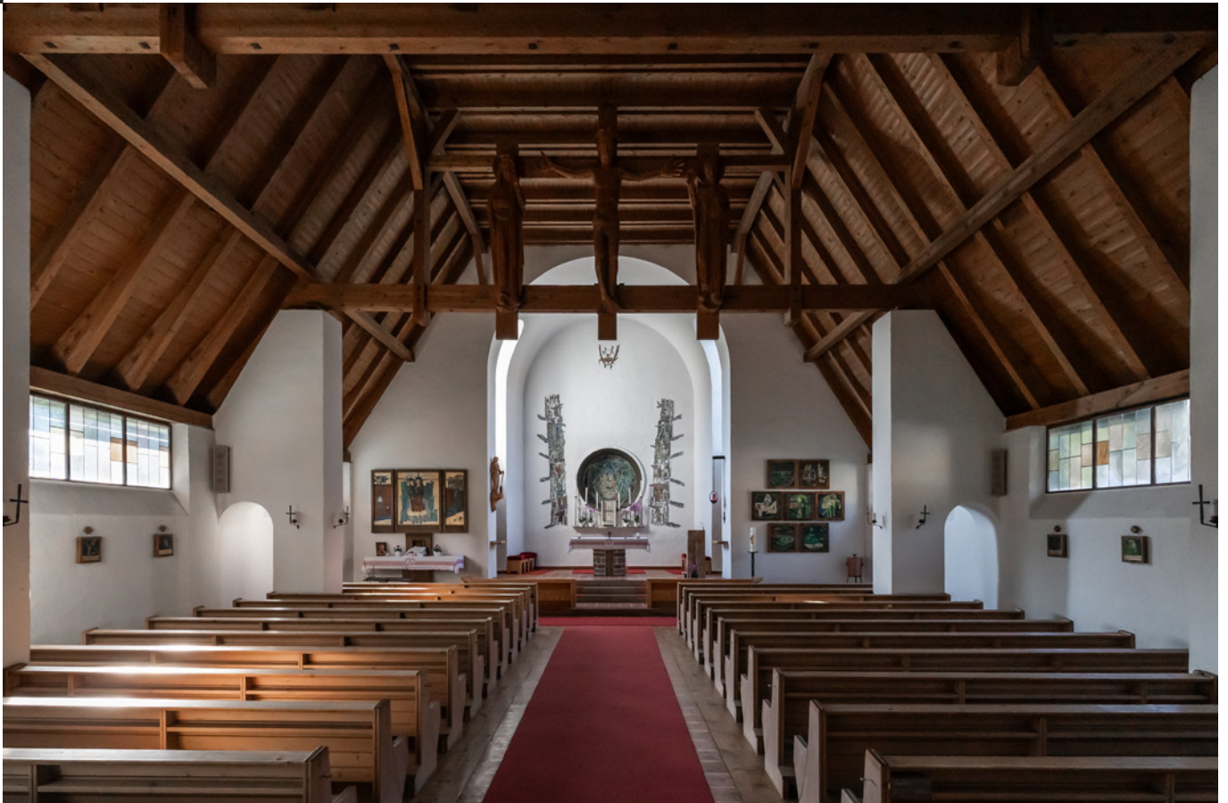
Figg. 9-10 Giovanni Klaus Koenig, Gianfranco Cerrina Feroni, Claudio Messina, Tempio Valdese di San Secondo di Pinerolo, 1956.