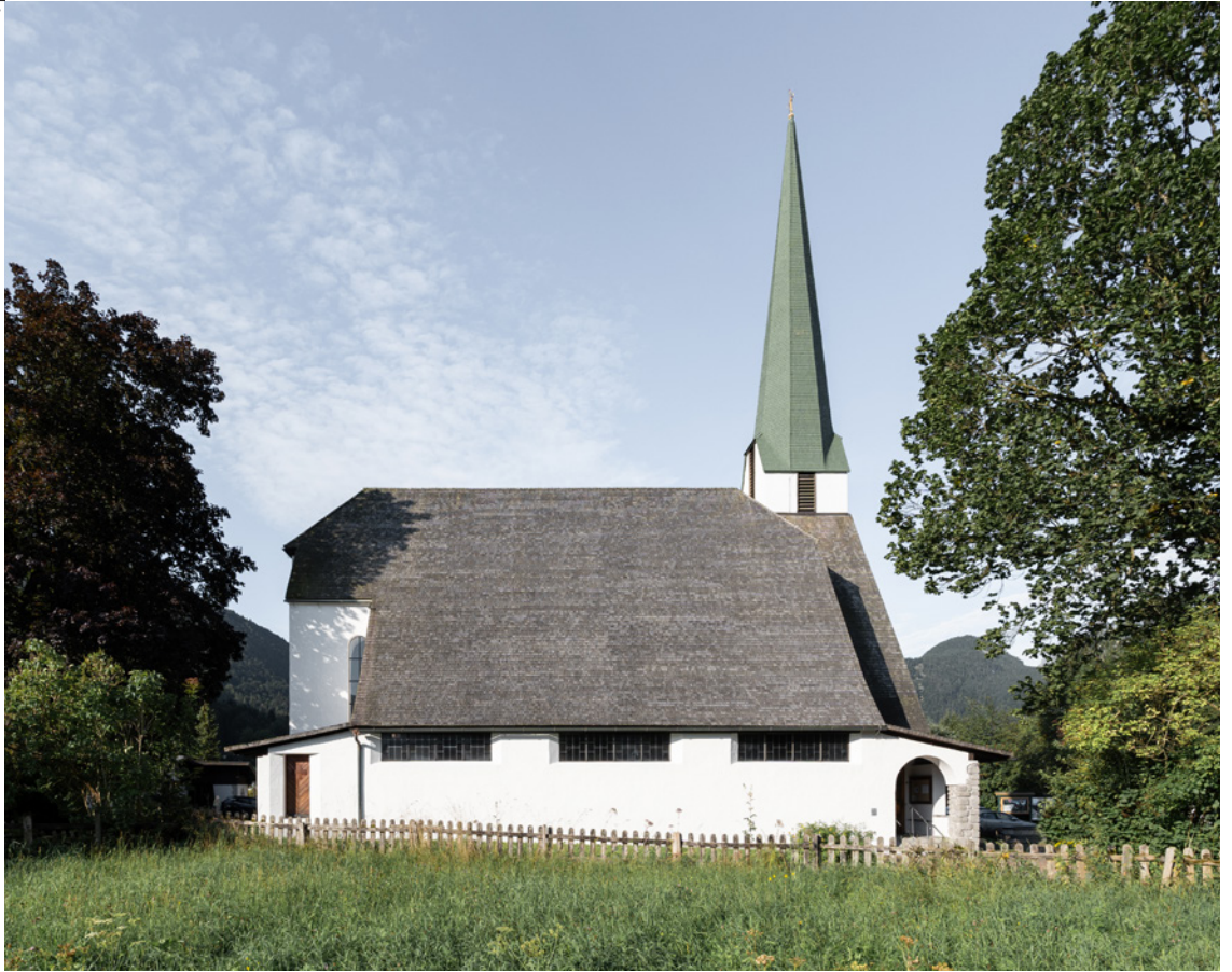
Figg. 7-8 Clemens Holzmeister, Filialkirche, Erpfendorf, 1954-1957.