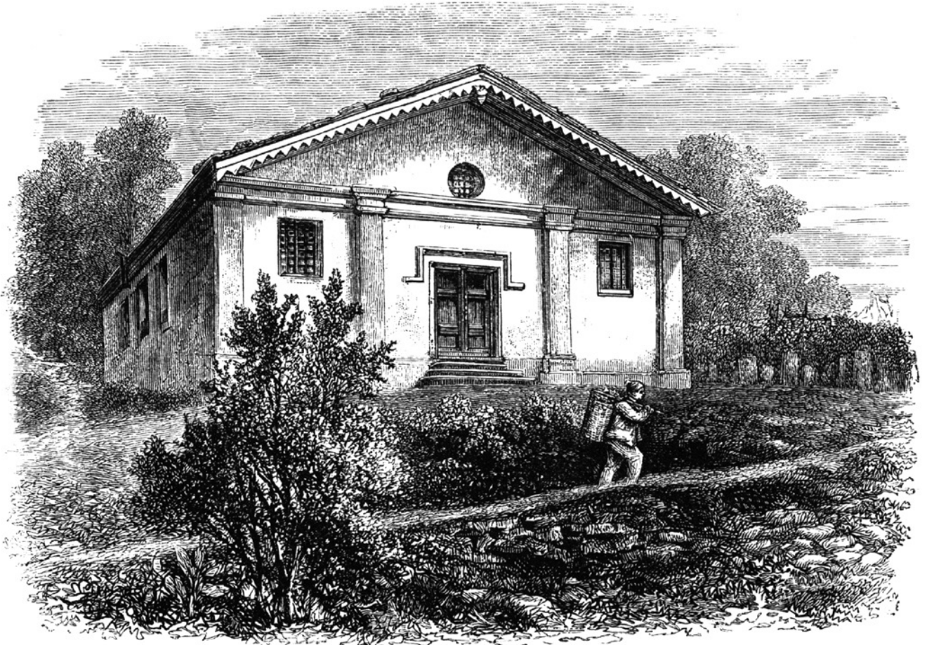
Fig. 3 Jane Louisa Willyams, The Waldensian Church in the valleys of Piedmont , 1878.