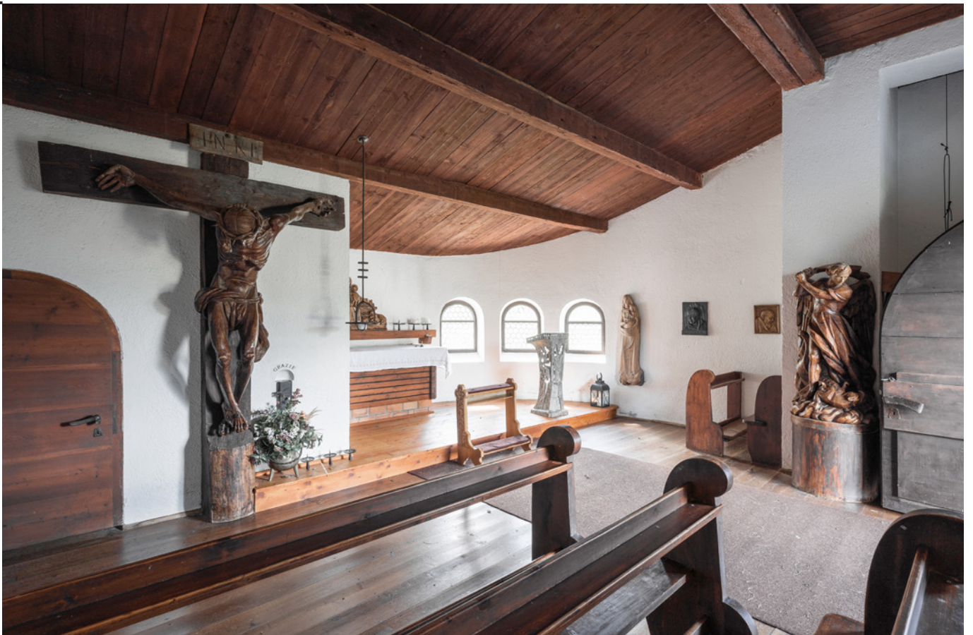
Fig. 6 Cappella, Plateau Rosa, Carlo Mollino, 1940-41, tavola con prospetti, pianta e schizzi prospettici (documentazione d'archivio: P11D, 345).