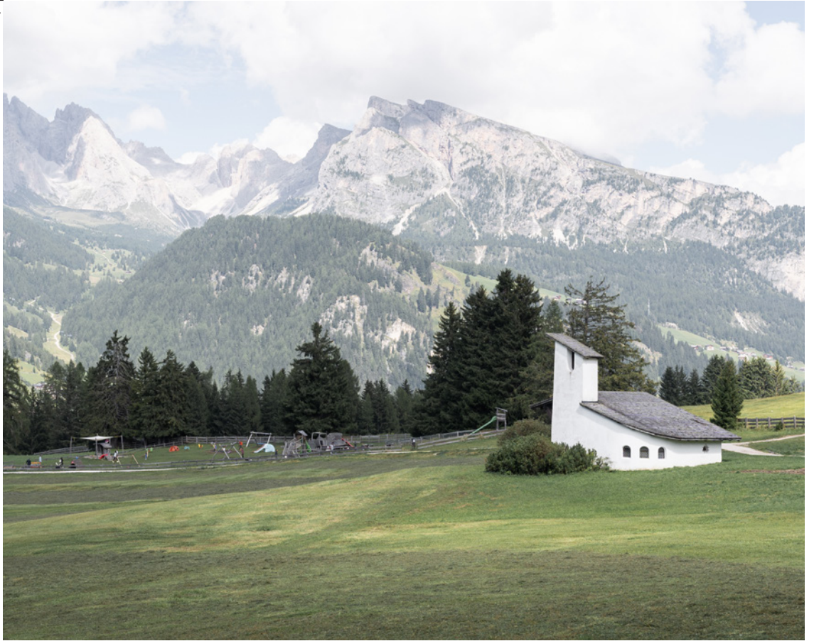
Fig. 4-5 Franz Baumann, Cappella Monte Pana, 1935.