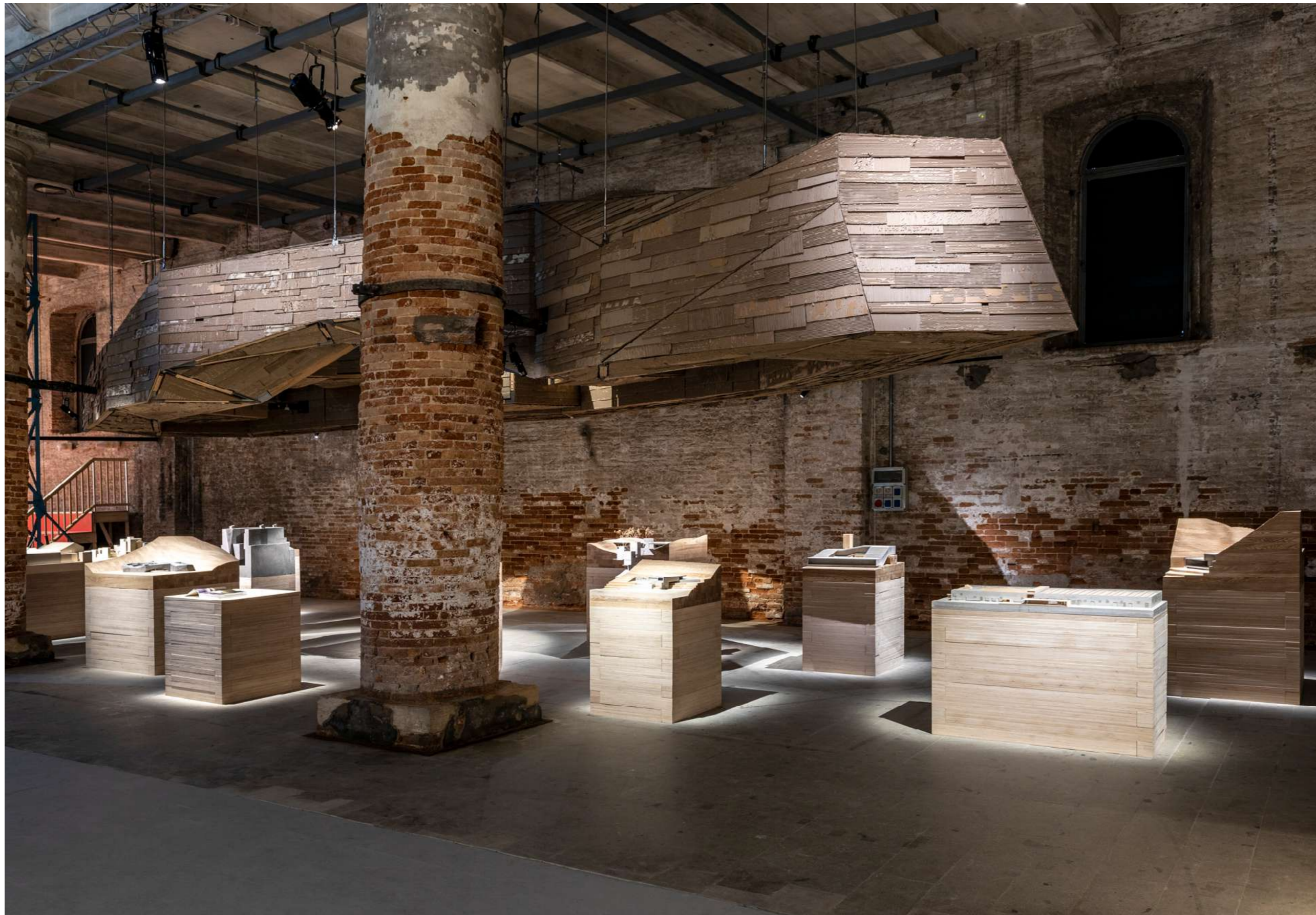
03. ZAO / standardarchitecture, Co-Living Courtyard, foto di Marco Zorzanello, courtesy La Biennale di Venezia | ZAO / standardarchitecture, Co-Living Courtyard, photo by Marco Zorzanello, courtesy La Biennale di Venezia