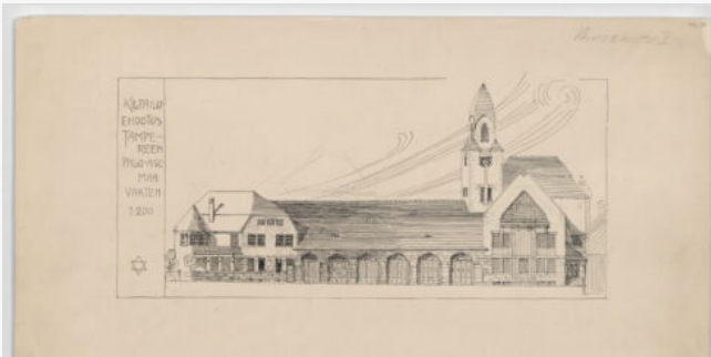
Wivi Lönn: Caserma centrale dei Vigili del Fuoco a Tampere, disegno di concorso, 1905 (© Museum of Finnish Architecture)

Immagine di copertina: Wivi Lönn nello studio della sua casa di Jyväskylä, 1915 (© Museum of Central Finland / Wilhelm Lönn)