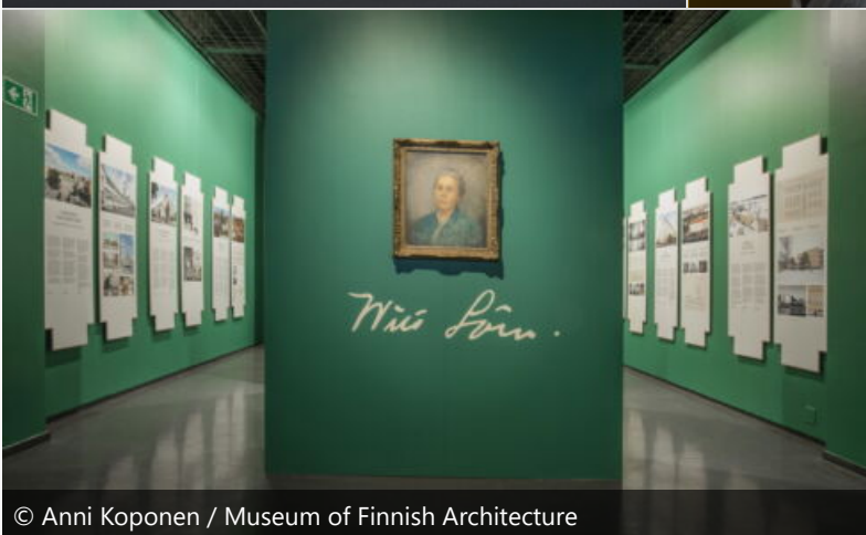
© Anni Koponen / Museum of Finnish Architecture