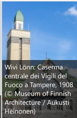
Wivi Lönn: Caserma centrale dei Vigili del Fuoco a Tampere, 1908