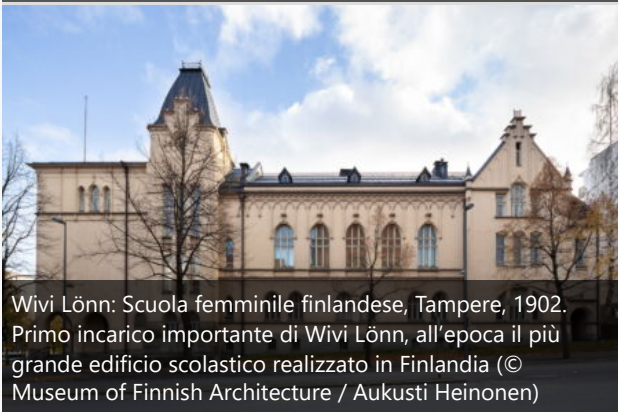
Wivi Lönn: Scuola femminile finlandese, Tampere, 1902. Primo incarico importante di Wivi Lönn, all'epoca il più grande edificio scolastico realizzato in Finlandia