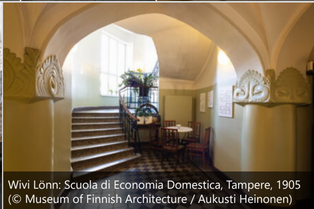
Wivi Lönn: Scuola di Economia Domestica, Tampere, 1905