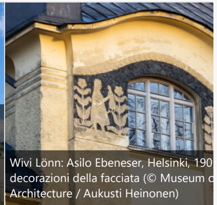
Wivi Lönn: Asilo Ebeneser, Helsinki, 1900 decorazioni della facciata