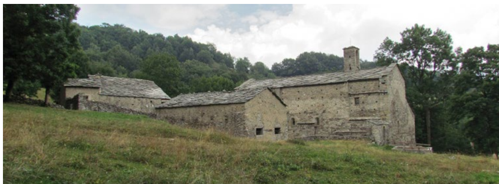
2: Certosa di San Benedetto in Val di Susa.