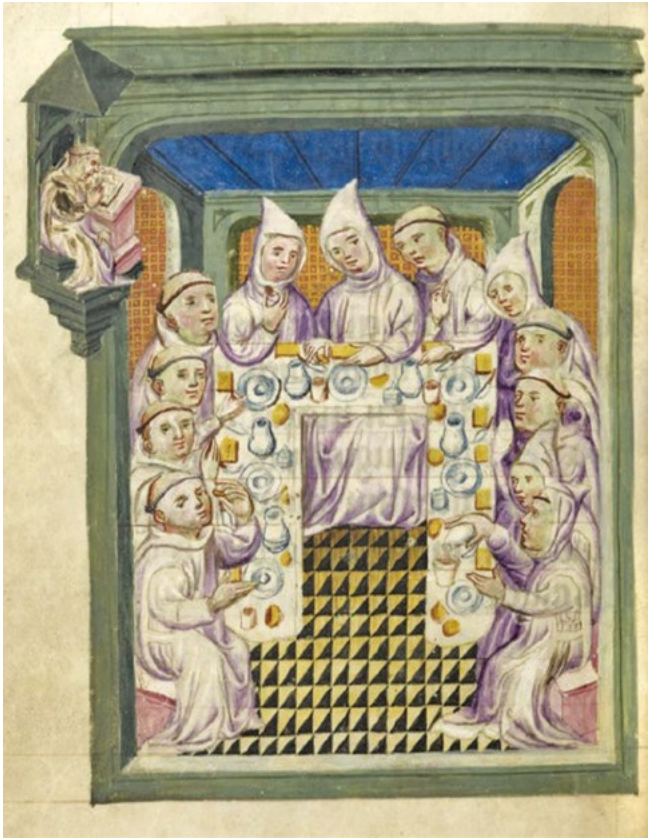
4: I certosini a pranzo nel refettorio. Londra, British Library, Add MS 25042, Religious and other tracts in Flemish , viz.1, f. 22v.

All'interno del refettorio dove, durante il pranzo comune, non era ammesso il dialogo, si svolgevano alcune cerimonie indicate negli Statuti del 1271; un monaco leggeva dal pulpito brani della Sacra Scrittura riprendendo quanto sospeso nell'ufficio di notte avvenuto in chiesa o in alternativa gli Statuti o le letture relative alla festa del giorno utili alla vita spirituale. Nel refettorio della certosa digionese di Champmol, la cattedra del lettore, di fine bellezza e esecuzione, è stata commissionata a Jean de Marville nella seconda metà del XIV secolo [Mérindol 1989]. Gli edifici per la produzione e la somministrazione dei pochi pasti in comune si dispongono intorno al piccolo chiostro, in analogia a ciò che veniva realizzato nella contemporanea architettura degli altri ordini monastici [Beltramo 2018b].