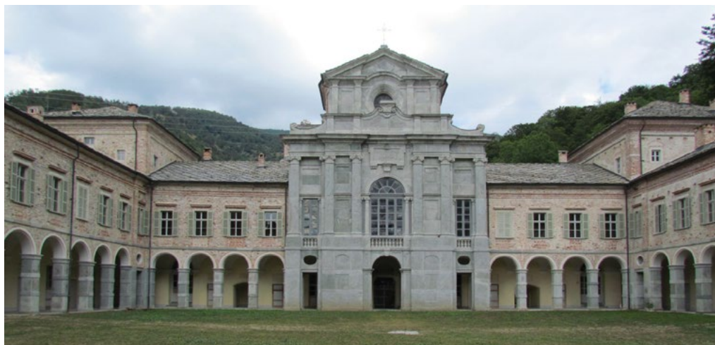
1: Certosa di Casotto nel sud del Piemonte tra valli Tanaro e Pesio.