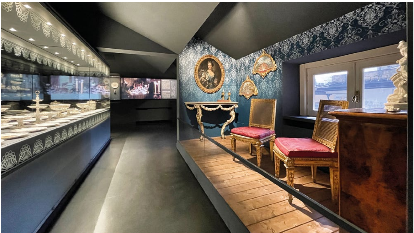
Palazzo Spinola, Genova, riallestimento Sale arti decorative. Negli spazi dell'ultimo piano, ricostruiti dopo i bombardamenti della Seconda guerra mondiale, si evocano le ambientazioni nelle quali erano collocati gli oggetti, avvicinando così il pubblico alle atmosfere genovesi tra Sette e Ottocento (credits: Officina delle Idee).

Gli istituti del Ministero, insieme a quelli gestiti dagli enti locali, costituiscono un insieme eterogeneo nel quale mi risulta difficile individuare delle specificità. In questo momento una delle aspettative principali che li accomuna consiste nel recuperare le risorse attraverso la partecipazione ai bandi, attività di cui non sono peraltro esentati i privati. È raro che siano immediatamente disponibili le risorse necessarie per effettuare un restauro o un riallestimento, una manutenzione straordinaria o l'adeguamento normativo. Spesso si deve intervenire per parti e non necessariamente è possibile garantire la continuità degli stessi professionisti. Il Codice Appalti, che si aggiorna con rapida frequenza, incide pesantemente sulle scelte di chi gestisce l'opera pubblica, il responsabile del procedimento. Le grandi commesse passano attraverso il meccanismo dei concorsi, stazioni appaltanti che spesso sono estranee alla stessa amministrazione che usufruirà del servizio. Non è necessariamente un fattore negativo ma non sempre è garanzia di qualità. Sono più gli aspetti procedurali a essere trainanti rispetto al risultato concreto del lavoro di chi progetta e delle imprese che realizzano. È però vero che negli anni incontriamo sempre più funzionari appassionati che hanno spostato sul prodotto tutti i loro sforzi.