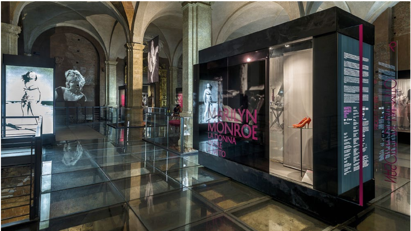
Palazzo Madama, Torino, mostra Marilyn Monroe La donna oltre il mito. Le teche che accolgono abiti e oggetti d'affezione al loro primo utilizzo. Verranno riutilizzate quattordici volte dalla Fondazione Torino Musei non solo a Palazzo Madama.

di capolavori tali e resi tali dalla critica (o dai social) regge la debole e instabile attenzione dei visitatori. La mostra di Antoine de Lonhy a Palazzo Madama si apriva con un cavallo in resina perfettamente bardato che evocava il viaggio dell'artista: è stato l'oggetto più fotografato, fondale di infiniti selfie.