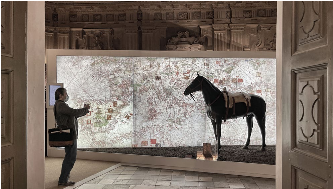
Palazzo Madama, Torino, mostra Il Rinascimento europeo di Antoine de Lonhy. La riproduzione ipotetica del cavallo dell'artista è presto diventata l'oggetto più fotografato della mostra insieme alla ricostruzione scenografica del rosone di Santa Maria del Mar di Barcellona.

Seguiamo la manutenzione di alcuni edifici che formano il nostro patrimonio culturale. È un'attività che pochi colleghi vogliono fare, sicuramente meno appariscente, come giustamente fai notare, rispetto alle progettazioni. Mi verrebbe da dire che un po' di cantieri manutentivi farebbero bene a tutti! Alcune scelte sarebbero così evitate. Basterebbe pensare alle capacità e alle risorse messe in campo per le pulizie. Per contratto, per contenere i costi, molte imprese che