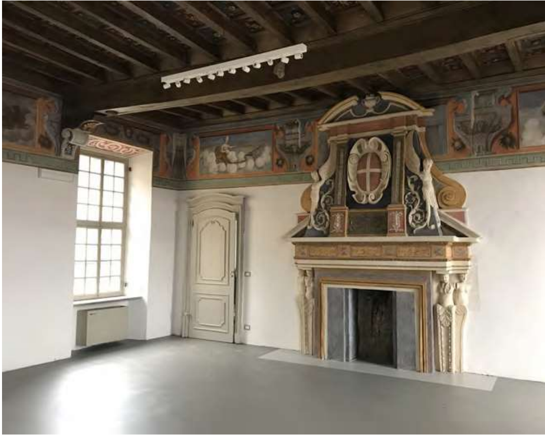
Fig. 3. Foglizzo. Castello, la Stanza dei Trionfi, dopo l'intervento di restauro, 2018.