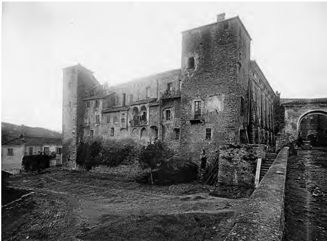
Fig. 4. Monastero Bormida. Il castello visto da sud est, fotografia secondo quarto XX secolo. BCMB, Dossier immagini , V3PRO7.