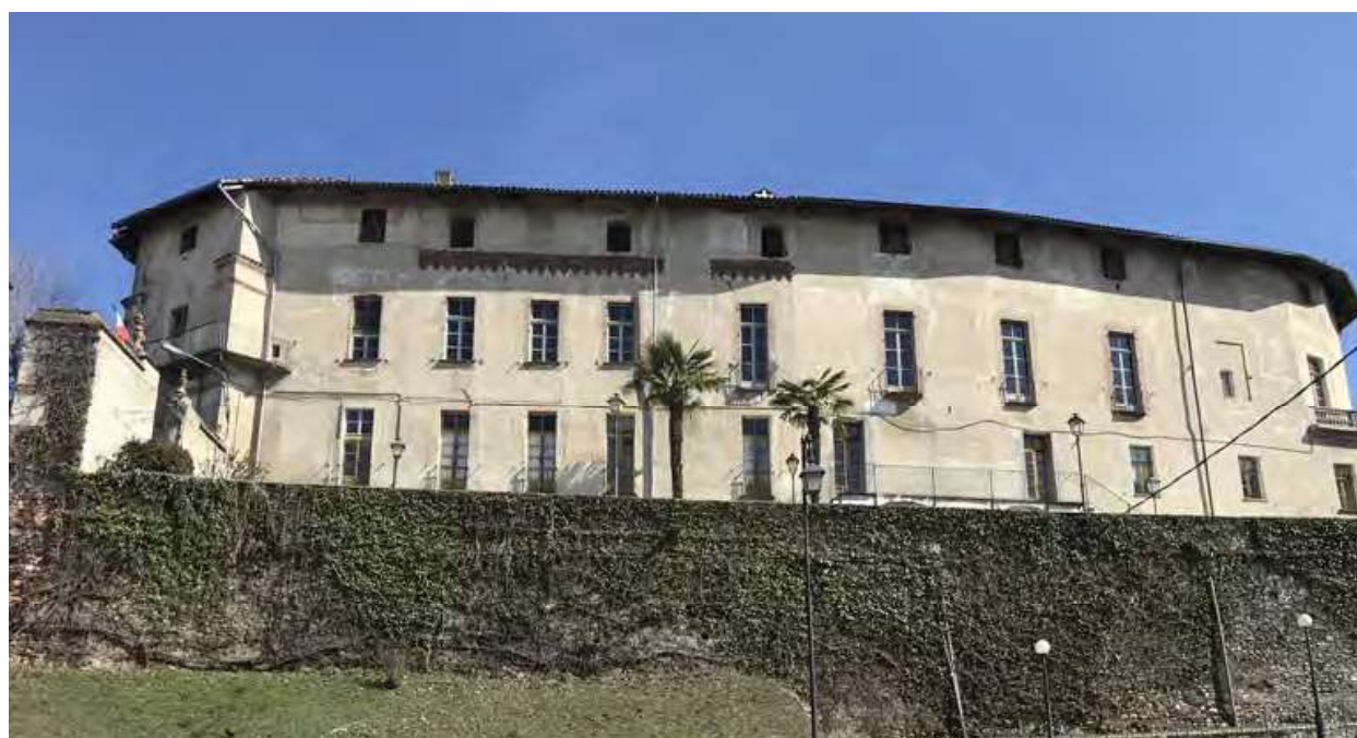
Fig. 2. Foglizzo. Castello, fronte ovest, 2023.