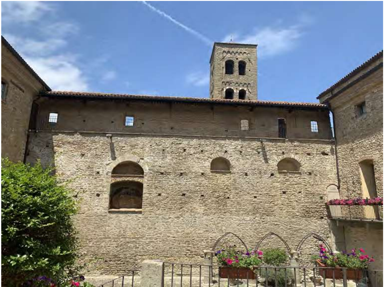
Fig. 6. Monastero Bormida. Castello, corte interna, la manica nord e la torre campanaria, 2022.