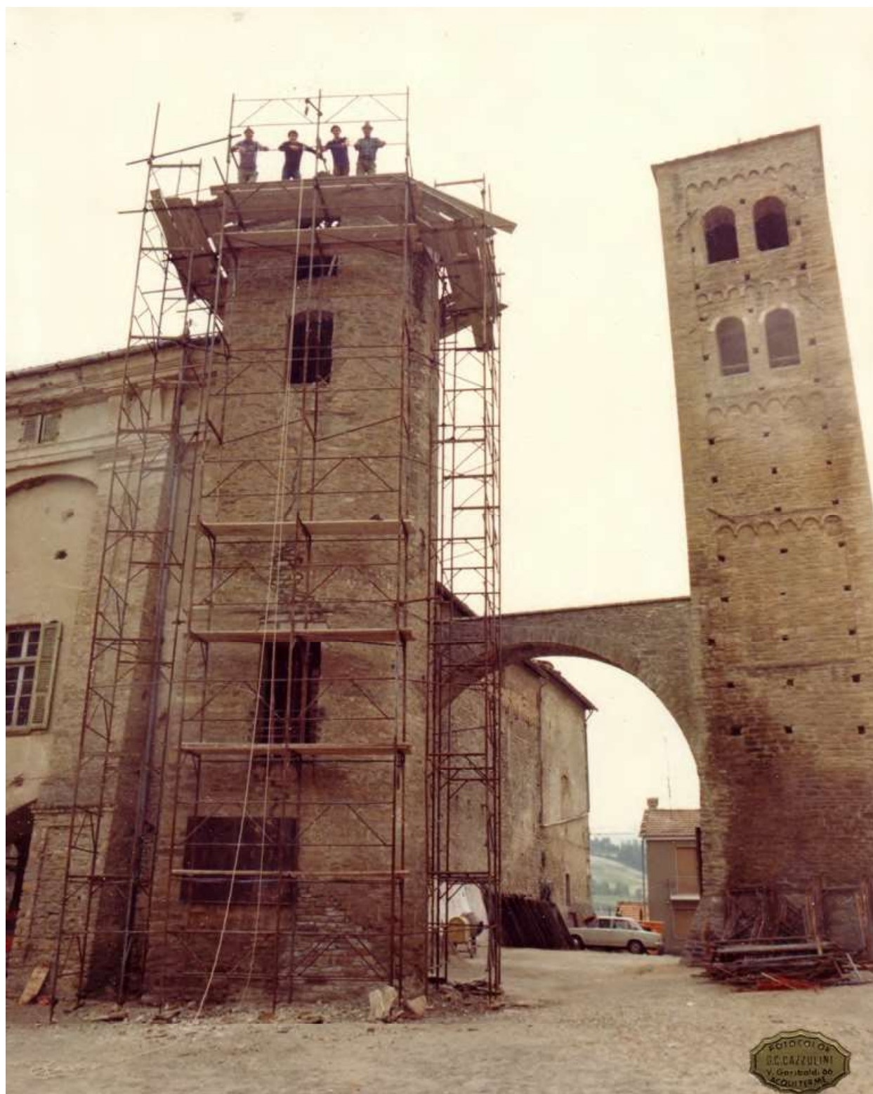
Fig. 5. Monastero Bormida. Castello, la torre nord in restauro, fotografia fine anni Sessanta del XX secolo. BCMB, Dossier immagini , Restauro Torre impresa Armando Guglieri, GR2.