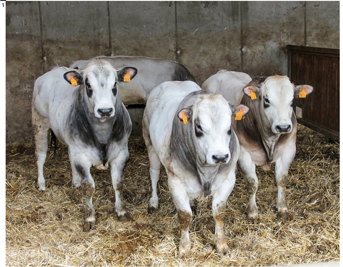
Figg. 1-2 Vitelli e vacche da riproduzione piemontesi in lettiera permanente di paglia.