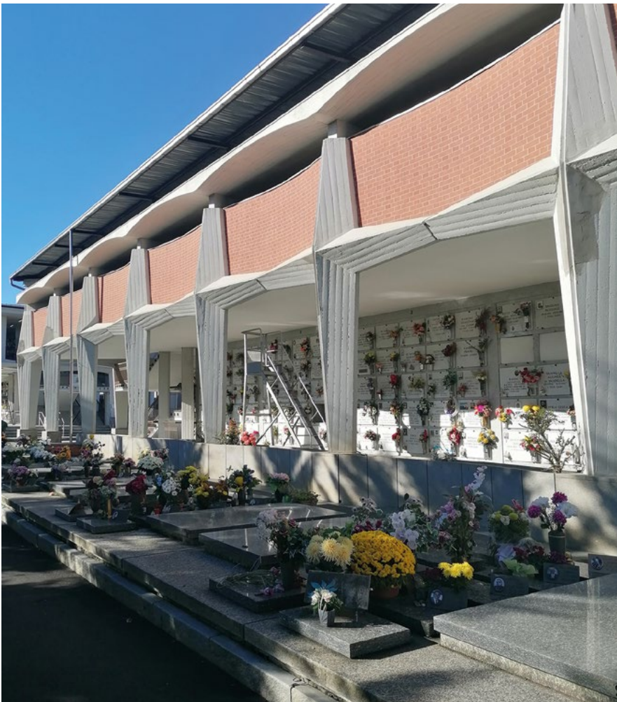
Fig. 1 - Cimitero Monumentale settima ampliamento, complessi loculi a croce.