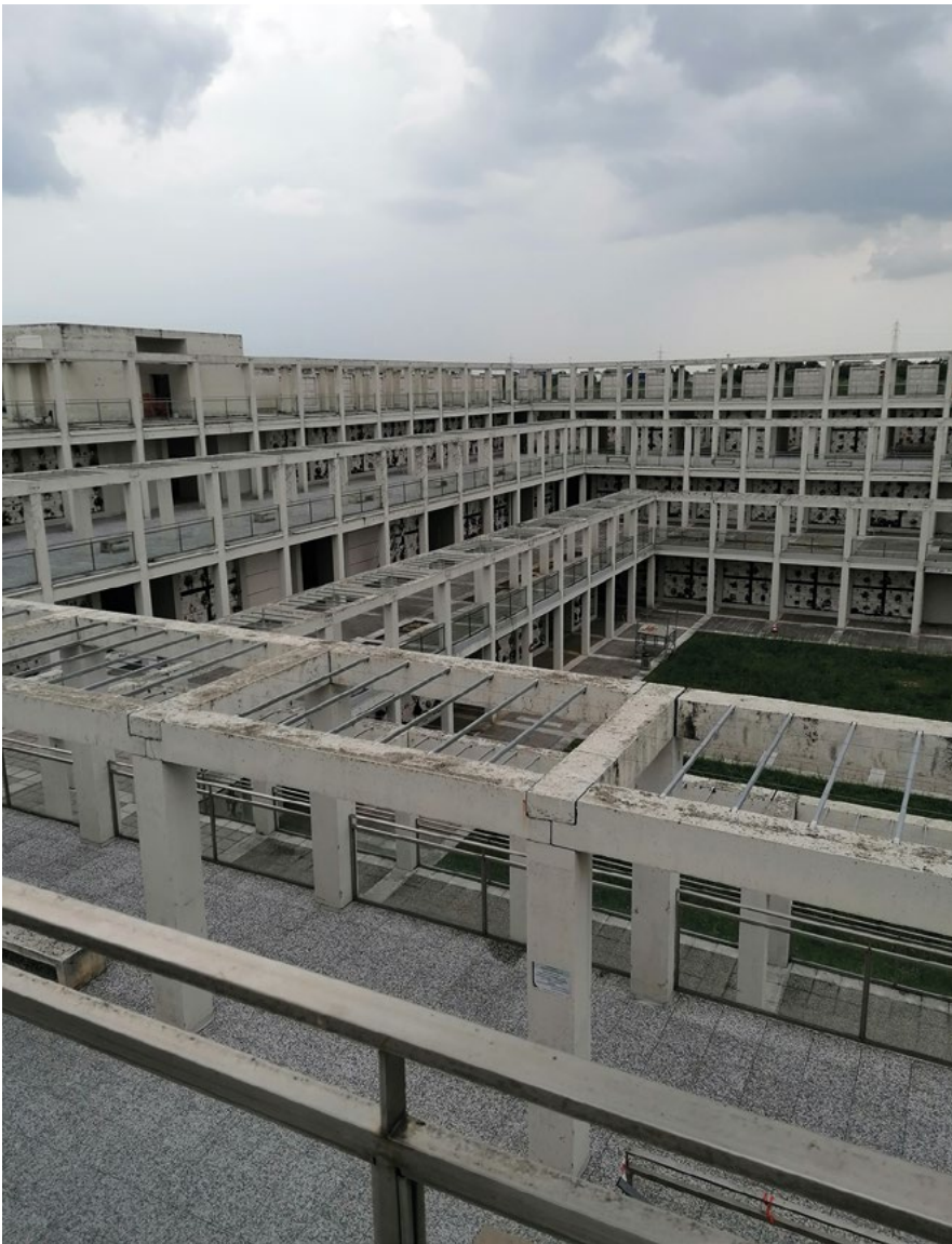
Fig. 3 - Complesso loculi Collina della Memoria, Massimo Raschiatore Architetti 2008 (N. Paganelli, 2023).