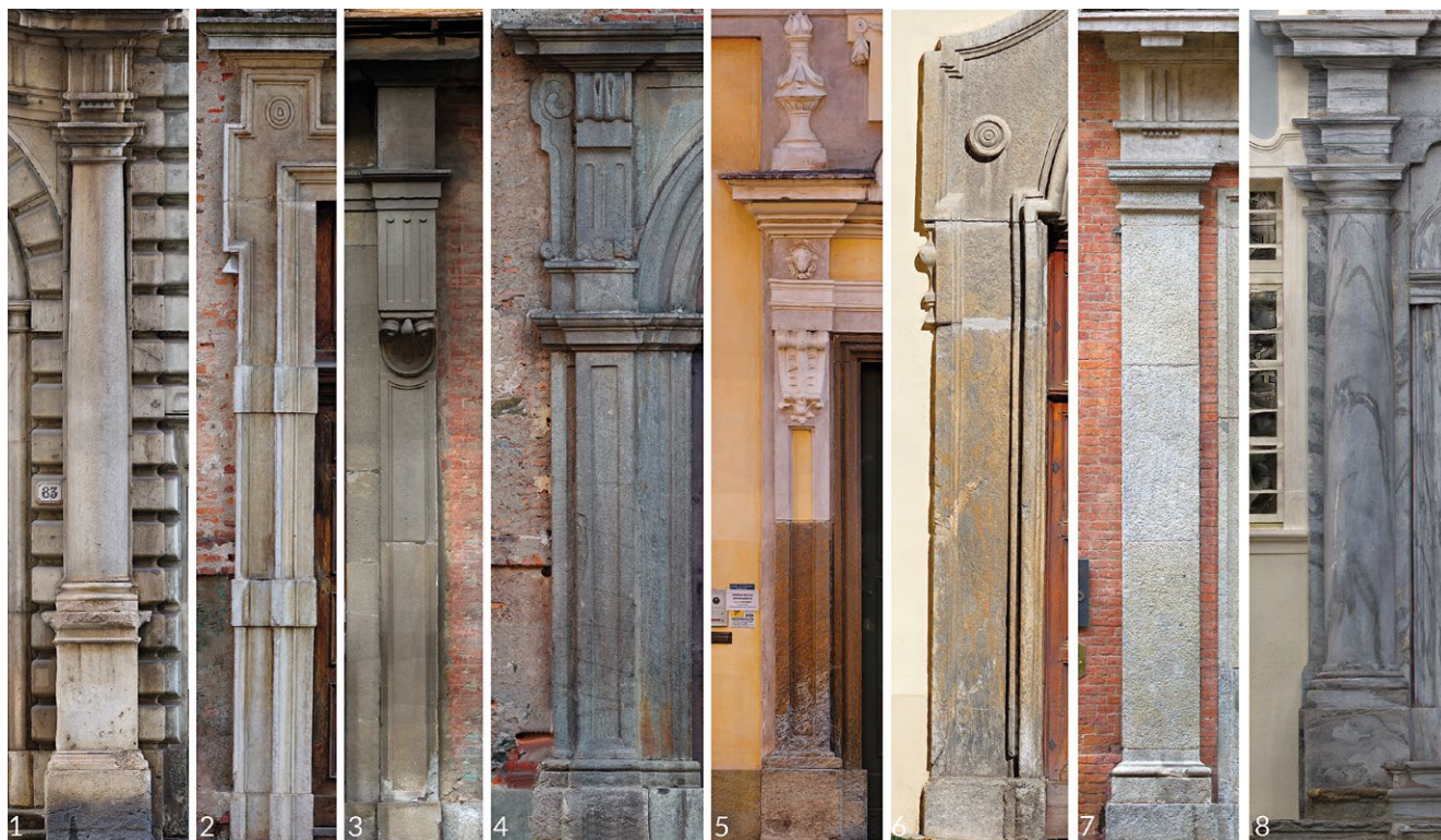
fig. 2 – I piedritti dei portali dei Seminari diocesani, comparazione tra otto casi presi in esame (assente il portale di Casale privo di tali apparati). In ordine di inserimento, i Seminari di Torino (1), Mondovì (2), Asti (3), Ivrea (4), Fossano (5), Susa (6), Alessandria (7), Aosta (8). Ortofoto dei prospetti frontali, non in scala grafica, non in proporzione.