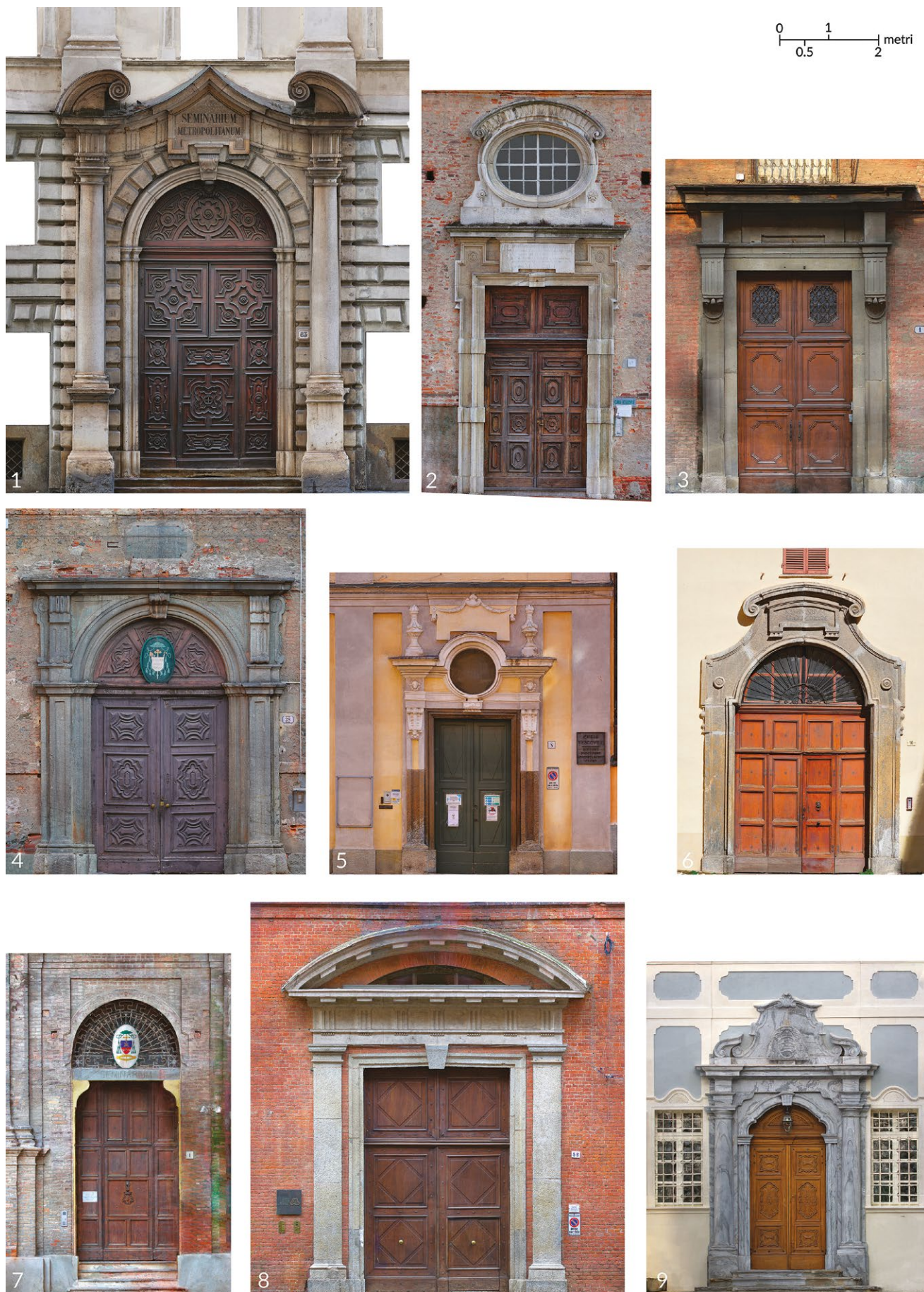
fig. 1 - Comparazione tra i portali dei complessi architettonici di formazione del clero secolare della Regione Ecclesiastica Piemontese ri-edificati nel corso del XVIII secolo. In ordine di inserimento i Seminari di Torino (1), Mondovi (2), Asti (3), Ivrea (4), Fossano (5), Susa (6), Casale (7), Alessandria (8), Aosta (9). Ortofoto dei prospetti frontali, in scala.