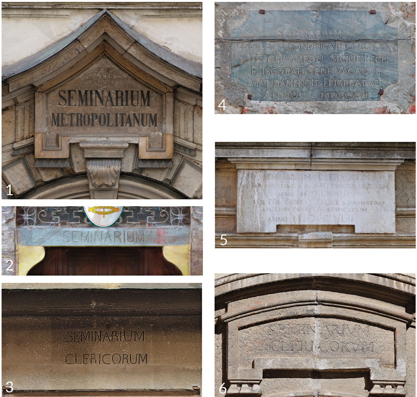
fig. 4 - Le epigrafi inserite in relazione agli apparati dei portali dei Seminari di Torino (1), Casale (2), Asti (3), Ivrea (4), Mondovì (5), Susa (6). Ortofoto, non in scala grafica, non in proporzione.

della rilevanza della fabbrica, e ben coniugato con i due stipiti dell'apertura, quale richiamo altresì al tema biblico del tempio di Gerusalemme, già caro alla cultura giudaico-cristiana. La presenza delle colonne impone o rievoca, la presenza di un'architrave, che, qualora presente, appare per lo più monolitica, e, a seconda dei linguaggi architettonici adottati, lavorata secondo molteplici guise ma quasi sempre coronata da un frontone, intero o spezzato 20 , volto a conferire maggiore slancio alla conformazione del portale. In questo periodo appaiono rari i casi di balcone sommitale, qui ascrivibile solo al caso di Asti, laddove l'affaccio con parapetto o balaustrina appare richiamare più il modello di residenza patrizia che di collegio ecclesiastico, percezione rimarcata nel caso astigiano dai due grandi modiglioni in pietra che costituiscono il coronamento dei due stipiti