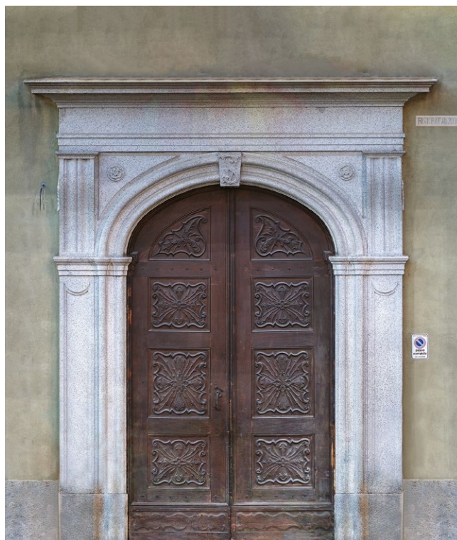
fig. 5 – Il portale del Seminario Diocesano di Acqui Terme, caso di specchiatura ottocentesca in granito bianco applicata ad una facciata eretta nel corso del XVIII secolo, qui riportata per completezza. Ortofoto, non in scala grafica, non in proporzione.

risollevarle le sorti delle fabbriche che, per mutate condizioni sociali ed ecclesiali paiono rimaste senz'anima.