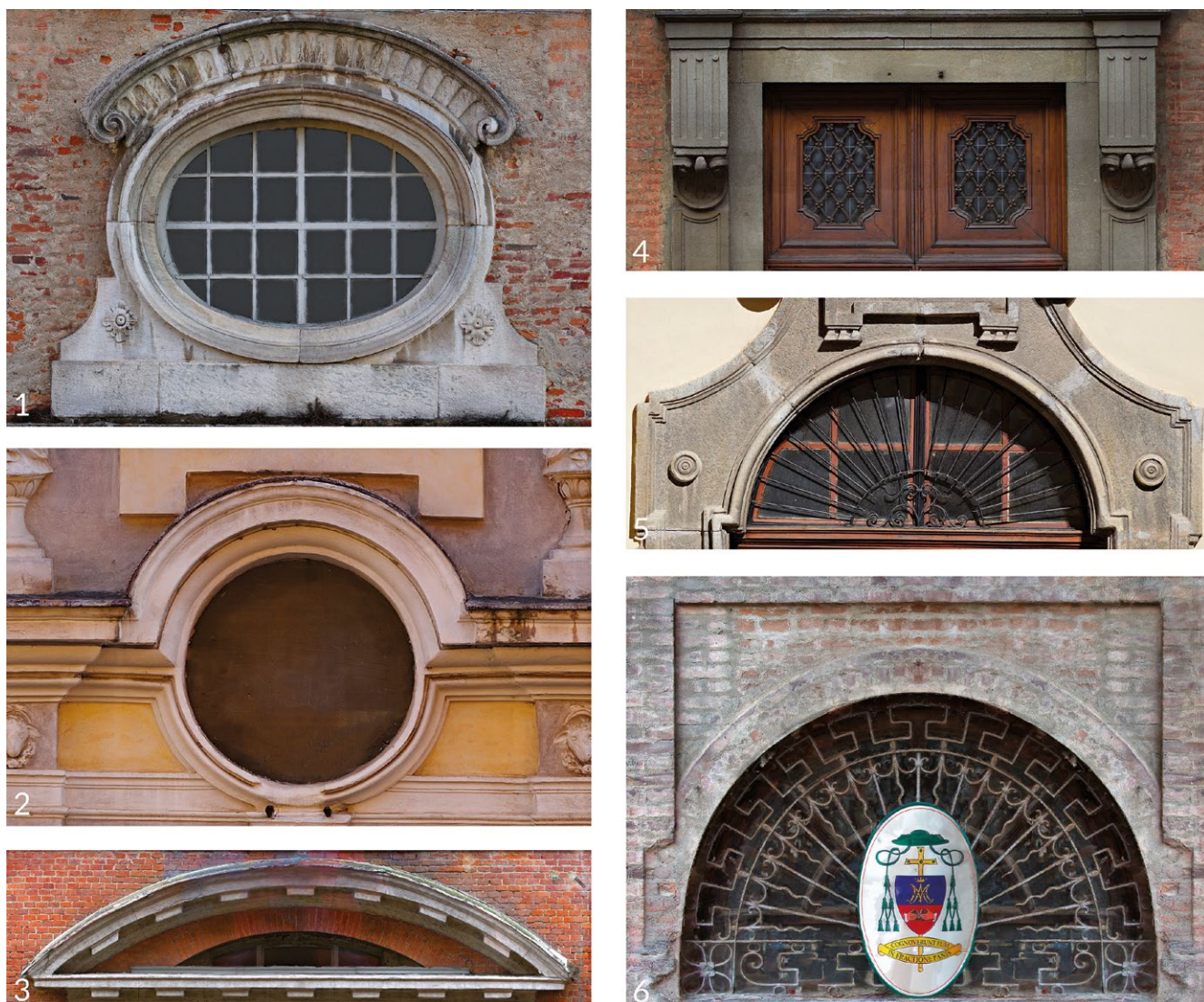
fig. 3 – Le molteplici forme di prese di luce dei portali tra oculi, finestre, inserti vetrati e lunette. In ordine i casi relativi ai Seminari di Mondovì (1), Fossano (2), Alessandria (3), Asti (4), Susa (5), Casale (6). Ortofoto dei prospetti frontali, non in scala grafica, non in proporzione.

torinese, fin dalla sua fondazione antepone al portale alcuni scalini in pietra, così come accade a Mondovì 17 , mentre a Fossano, ad Aosta e a Casale la dimensione dell'apertura non consente l'accesso a carri. Persa nella maggioranza dei casi la funzione di varco carraio, l'atrio assume il ruolo di accesso aulico e di pre-ingresso, utile a ricevere, senza respingere, l'ospite per poi indirizzarlo, a seconda delle esigenze e dalla liceità della richiesta, all'interno delle mura del Seminario. Il Seminario di Aosta in questo rappresenta ancora una ulteriore singolarità declinando il ruolo di portineria ad un ingresso laterale, sul lato di levante, lasciando al portale in facciata, sul lato meridionale, il solo ruolo di accesso aulico dal grandioso giardino. Il Seminario di Fossano poi spicca per peculiarità nell'esaltare il ruolo della bussola d'entrata, qui sviluppata su forma ellittica, sulla quale prospettano più accessi, tra i quali l'ingresso della Cappella, tanto da concedere al visitatore l'accesso diretto allo spazio sacro senza entrare in contatto, se non in specifici momenti della giornata, con gli abitanti dello stabile. Caso analogo, seppur più semplificato, è