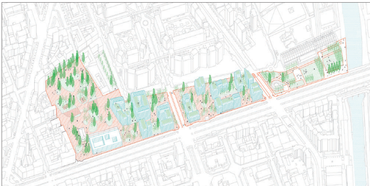
Fig. 10.3 Immagine complessiva di progetto.

città grazie ad allineamenti e ritmi carpiti dal contesto. Il layout architettonico rende possibile distinguere i singoli edifici mantenendo l'unitarietà dell'intervento grazie a un vocabolario compositivo comune a tutti i corpi di fabbrica: un volume semplice, l'altezza ridotta (tra 4 e 8 piani), la modularità della composizione, le ampie superfici vetrate, le terrazze a sbalzo (che creano anche un dialogo tra interno ed esterno), la vegetazione in copertura e il gradiente cromatico di tutti i materiali. Ogni edificio è progettato per poter essere realizzato attraverso l'assemblaggio e la combinazione di elementi prefabbricati che rendano la costruzione veloce, economica, replicabile e, addirittura, reversibile. Il quartiere viene pensato per essere un housing a grande scala, che unisce lo spazio abitativo a luoghi per il lavoro e a servizi aperti al quartiere, dove ogni edificio è un mix funzionale e le abitazioni sono considerate una struttura cooperativa, in cui è possibile vivere e lavorare, ma