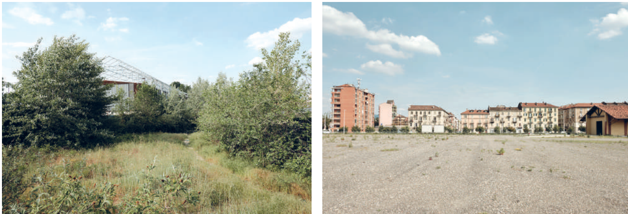
Fig. 10.2 Due immagini dello Scalo Valdocco a Torino.

causa della mancata crescita urbana, unitamente alla saturazione dell'offerta di alloggi residenziali e spazi per il terziario.