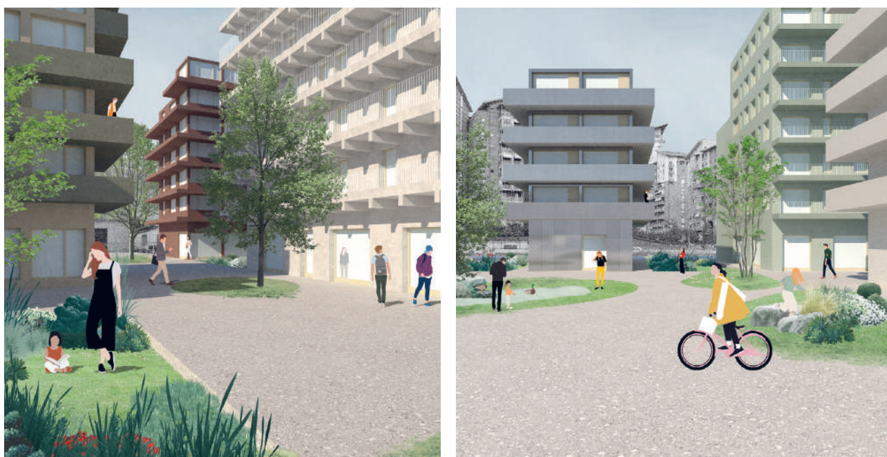
Fig. 10.4 Due immagini di progetto.

città grazie ad allineamenti e ritmi carpiti dal contesto. Il layout architettonico rende possibile distinguere i singoli edifici mantenendo l'unitarietà dell'intervento grazie a un vocabolario compositivo comune a tutti i corpi di fabbrica: un volume semplice, l'altezza ridotta (tra 4 e 8 piani), la modularità della composizione, le ampie superfici vetrate, le terrazze a sbalzo (che creano anche un dialogo tra interno ed esterno), la vegetazione in copertura e il gradiente cromatico di tutti i materiali. Ogni edificio è progettato per poter essere realizzato attraverso l'assemblaggio e la combinazione di elementi prefabbricati che rendano la costruzione veloce, economica, replicabile e, addirittura, reversibile. Il quartiere viene pensato per essere un housing a grande scala, che unisce lo spazio abitativo a luoghi per il lavoro e a servizi aperti al quartiere, dove ogni edificio è un mix funzionale e le abitazioni sono considerate una struttura cooperativa, in cui è possibile vivere e lavorare, ma