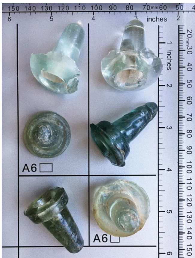
Figura 3. Ritrovamenti di fondine in vetro per la torcitura.

Vengono analizzati dati storici, geografici, socio-culturali e tecnici che si possono identificare con chiarezza solo nel momento in cui il ricercatore si introduce fisicamente nel territorio oggetto di studio ed interagisce con la comunità locale.