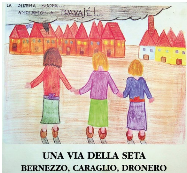
Figura 2. Copertina del volume Una via della seta. Bernezzo, Caraglio, Dronero . Interviste alle filere che lavorarono fra le due guerre mondiali, 1995, a cura delle scuole elementari di Bernezzo, Caraglio e Dronero.