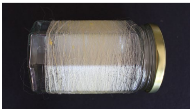
Figura 4. Prove di trattura.