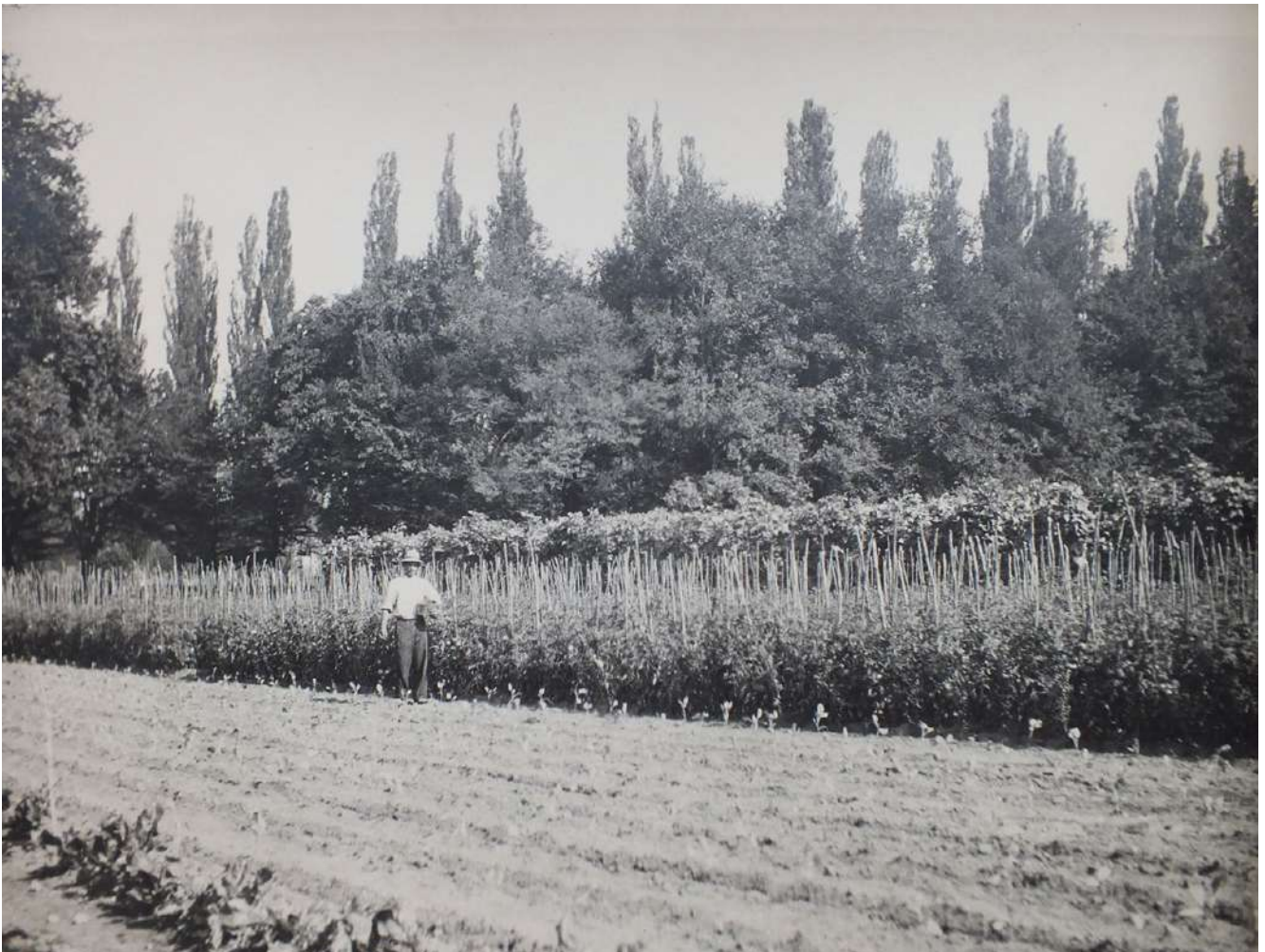
6: Nichelino, giardino della Palazzina di caccia di Stupinigi. Orti di guerra, cavoli, pomodori, fagioli, s.d., ma 1942 ca.