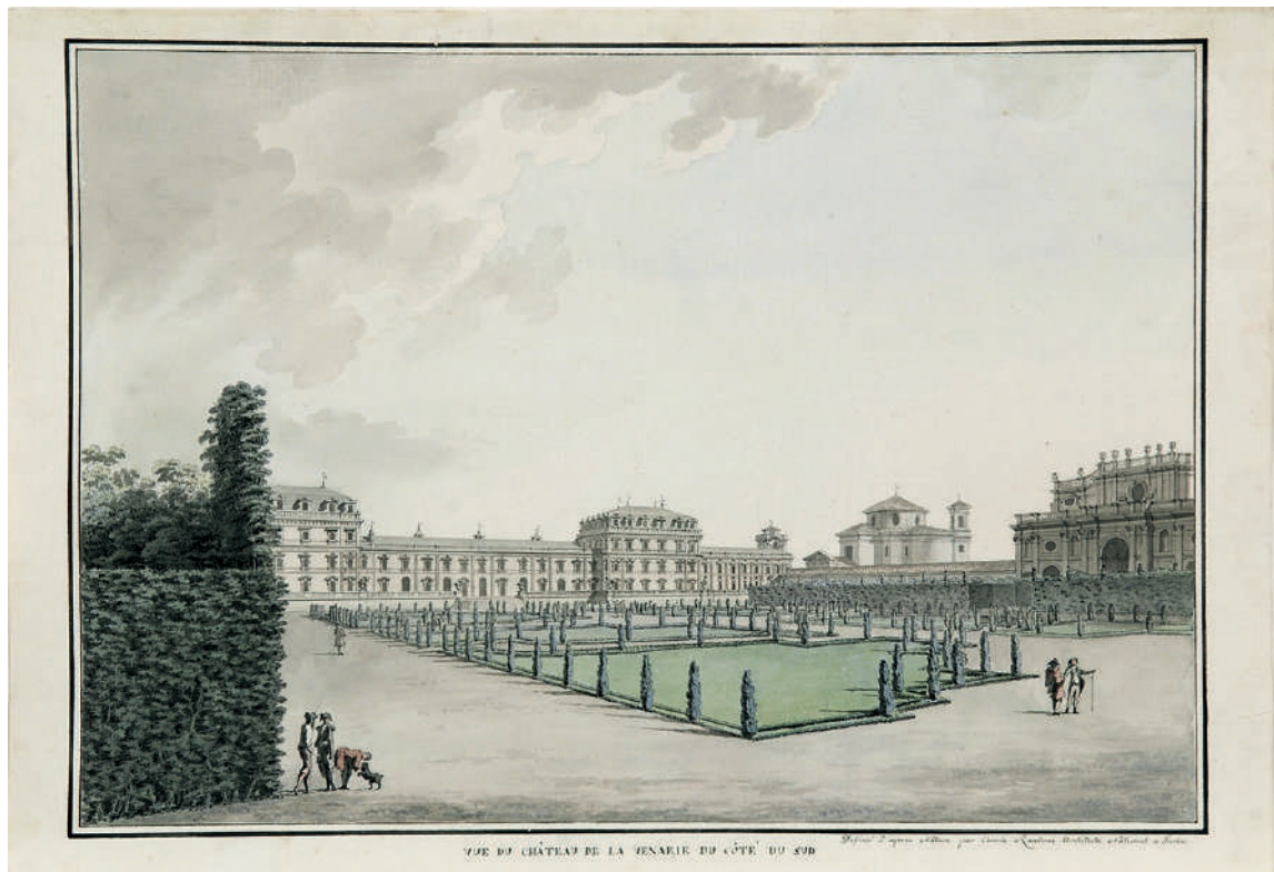
2: Carlo Randoni, Vue du Château de la Venarie du côté du Sud , s.d. ma 1801 ca.