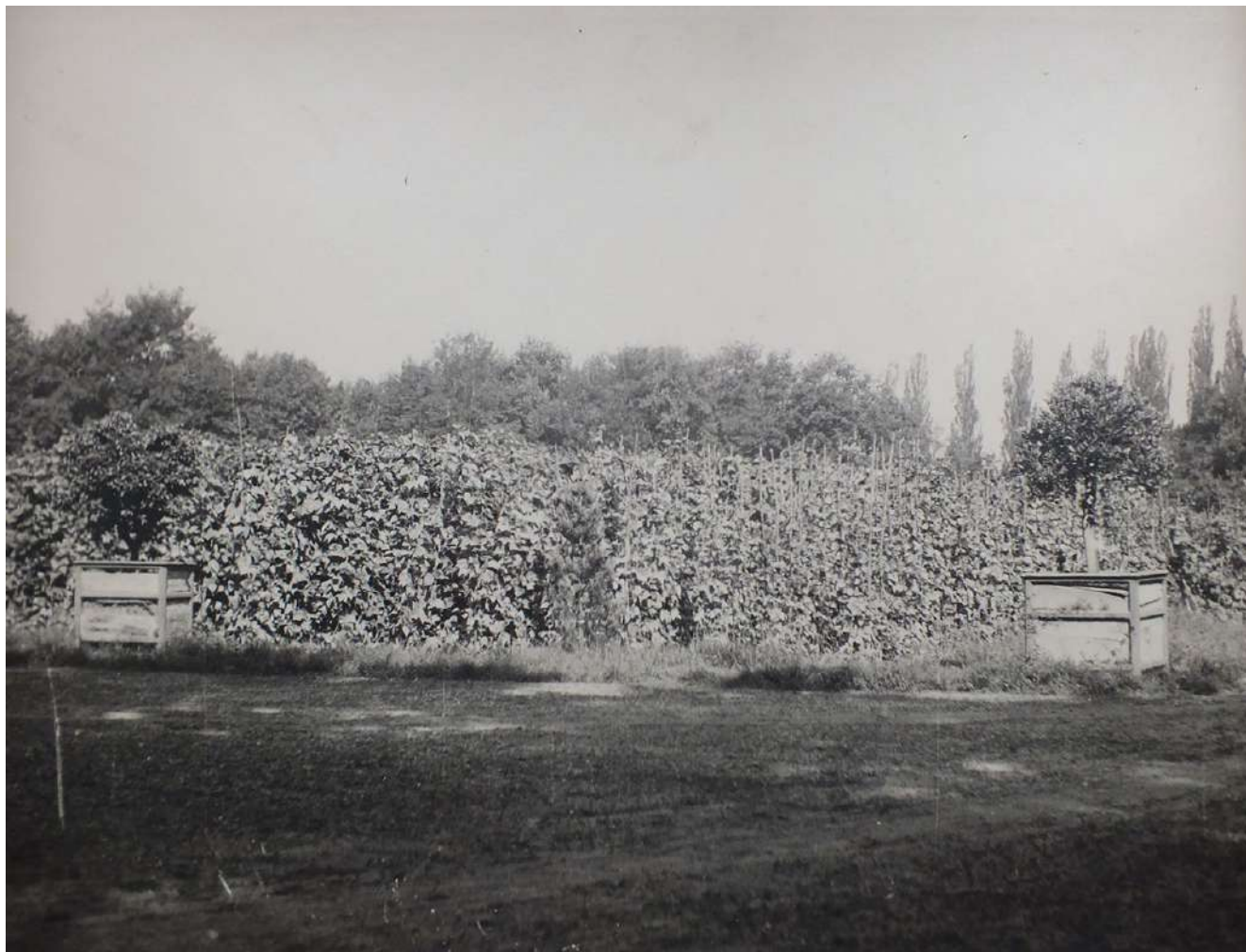
5: Nichelino, giardino della Palazzina di caccia di Stupinigi. Orti di guerra, fagioli rampicanti, s.d., ma 1942 ca.

Critico osservatore di tale prassi, utile più alla propaganda di regime che al sostentamento dell'economia nazionale e della popolazione, è il fiorentino Pietro Porcinai, il quale, riflettendo sulle detrazioni perpetrate a parchi e luoghi pubblici, scrive che «non solo è necessario mantenere alla Patria questo cospicuo patrimonio artistico rappresentato dai giardini, ma bisogna anzi darvi sempre maggiore incremento» 15 . Il mancato controllo degli orti di guerra, favorendo anche il mercato alimentare illecito, sarà regolamentato solo nel febbraio del 1943 16 , a pochi mesi dalla caduta del fascismo e dagli infausti eventi determinati dall'8 settembre.