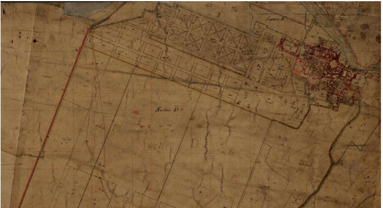
1: Carta dei territori della Venaria Reale, di Borgaro e di Caselle, 3.11.1802, parte V.

Lo stesso palazzo subisce simile sorte: gli arredi – in parte ancora presenti a fine dicembre 1798 – iniziano a essere venduti nelle aste dello stesso mese e del febbraio 1801, in parte sono portati a Torino; il palazzo appare completamente vuoto, alla commissione che avrebbe dovuto mettere i sigilli, giunta nel 1799 7 : erano state asportate anche tutte le serrature, le zanche dei telai, i piombi dei coperti.