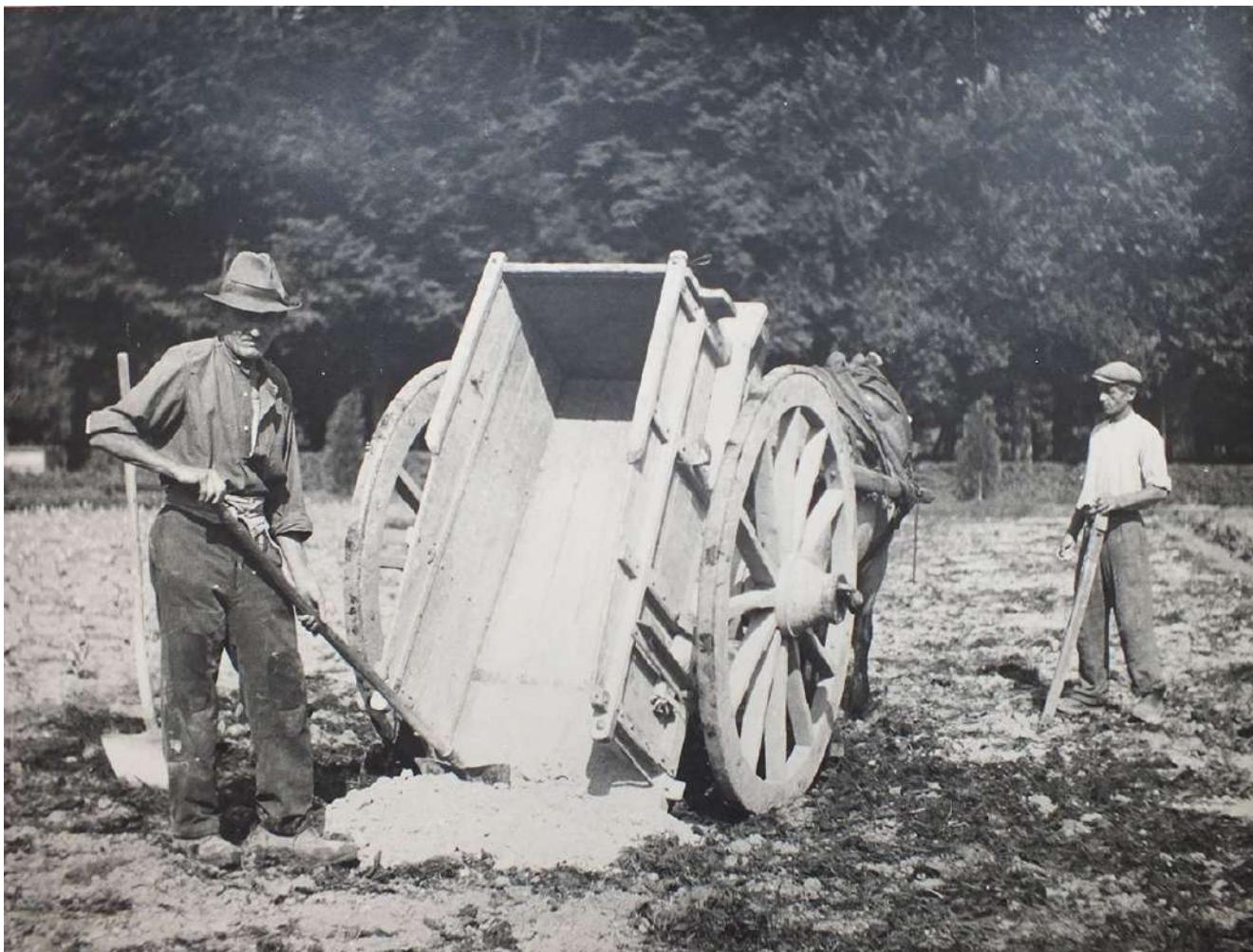
4: Nichelino, giardino della Palazzina di caccia di Stupinigi. Orti di guerra, concimazione per i fagioli, s.d., ma 1942 ca.

Si distinguono le casse con piante di agrumi inserite nelle piattabande incolte del parterre, le topiarie spettinate di Chamaecyparis poste a cadenza regolare lungo il perimetro, le basse carpinate a delimitazione dei boschetti limitrofi e gli iconici filari di pioppi cipressini al di là del muro di cinta. Le fotografie non riportano date, ma la schedatura le colloca tra il 1945 e il 1950. Tuttavia, gli eventi bellici citati, alcuni dettagli immortalati e le politiche del regime fascista aiutano a ricondurre le quattro immagini agli anni immediatamente precedenti all'occupazione tedesca, quando l'autarchia degli anni Trenta imposta da Mussolini aveva portato, fra il 1941 e il 1942, ad acuire i razionamenti alimentari e a promuovere la coltivazione di qualsiasi area utile [Panzini 2021, 85].