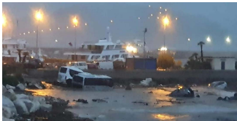
Immagini dell'alluvione del 26 novembre 2022.