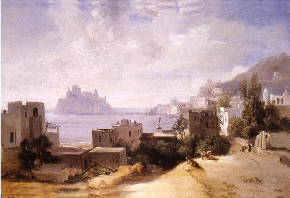
Fig. 1 - Giacinto Gigante, Marina di Ischia , 1825. Roma, Palazzo delle Belle Arti.

con quelle umane. “Nel loro fondersi con le dinamiche del mondo ‘fuori’ i nostri racconti danno voce a storie di ecosistemi, di processi, di situazioni in cui persone vulnerabili condividono lo stesso destino di terre e forme di vita vulnerabili. Ci parlano degli infiniti modi in cui il personale (ossia l’umano) si mescola con l’impersonale (ossia tutto il resto), aprendo così quell’interstizio che permette al personale e all’impersonale di trovare la propria via d’uscita nel mondo: di essere visti, riconosciuti, socializzati. Questi racconti ci fanno capire che riconoscere le storie impersonali è importante quanto riconoscere le storie personali, e che, ora più che mai, l’impersonale è politico . (...) É così che il paesaggio riafferma la sua natura di racconto comune, e diventa paesaggio civile” 2 .