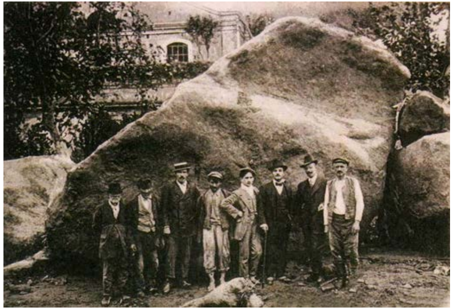
Casamicciola. Un'immagine degli effetti dell'alluvione del 1910