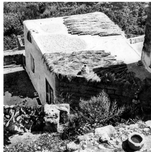
Scorci del paesaggio agrario di Ischia.