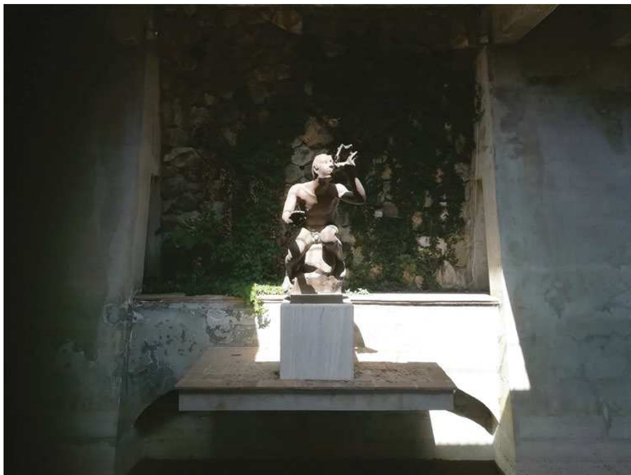
4 Herta von Wedekind, il Tritone , 1934, opera in bronzo, Acqui Terme, Villa Ottolenghi Wedekind, Cisternone.

finestre incorniciate dagli stessi esemplari arborei, con l'obiettivo di relazionarsi con il contesto di vigne e boschi dell'acquese secondo la vocazione insita nella «Città Ideale». Nell'impronta data dalla committente si leggono dunque tutti gli elementi architettonici, vegetali e idraulici che gli artisti di Monterosso avrebbero in seguito approfondito singolarmente, in un disegno di più ampio respiro che contempla l'intera tenuta e i suoi dialoghi con il paesaggio.