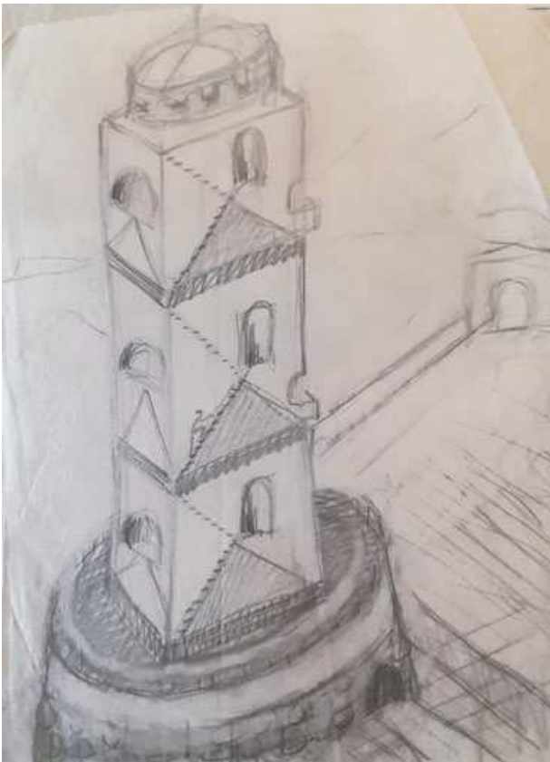
1: Herta von Wedekind, Schizzo per la «torre del sogno», s.d., matita su carta [Camaione, Archivio Ottolenghi Wedekind. Per gentile concessione. Si coglie l'occasione per ringraziare Valerio Finoli per la preziosa disponibilità].