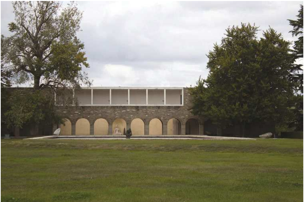
5: Acqui Terme, Giardino di Villa Ottolenghi Wedekind su progetto di Pietro Porcinai. Si richiama in particolare l'attenzione sulle relazioni compositive tra l'architettura razionalista, progettata da Giuseppe Vaccaro, e le opere scultoree della Bagnante di Herta Wedekind, collocata nella corte degli studi, e del Tobiolo di Arturo Martini, oggi sostituito da una copia nella medesima locazione al centro della piscina.

contemplazione della dimensione artistica di Monterosso, Porcinai dispone la componente vegetale ai margini del grande prato, che risulta così perimetrato dal pergolato di Vaccaro, dalla messa a dimora di conifere sul lato opposto e dalla presenza del giardino roccioso, pensato come filtro di separazione nei confronti della pertinenza privata legata alla dimora padronale. Attraverso una studiata collocazione di esemplari arborei sempreverdi all'interno della tenuta il progettista definisce infine privilegiate cornici sul paesaggio, valorizzando i rapporti – funzionali, compositivi e percettivi – che ancorano l'«acropoli delle arti» al contesto territoriale.