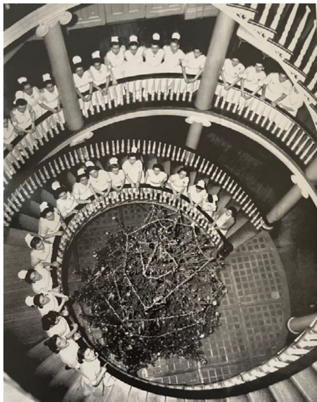
3: Il Metropolitan Hospital School of Nursing, Coro natalizio, s.d. [Metropolitan Hospital Center Archives, tratto da Berdy 2003, 20].