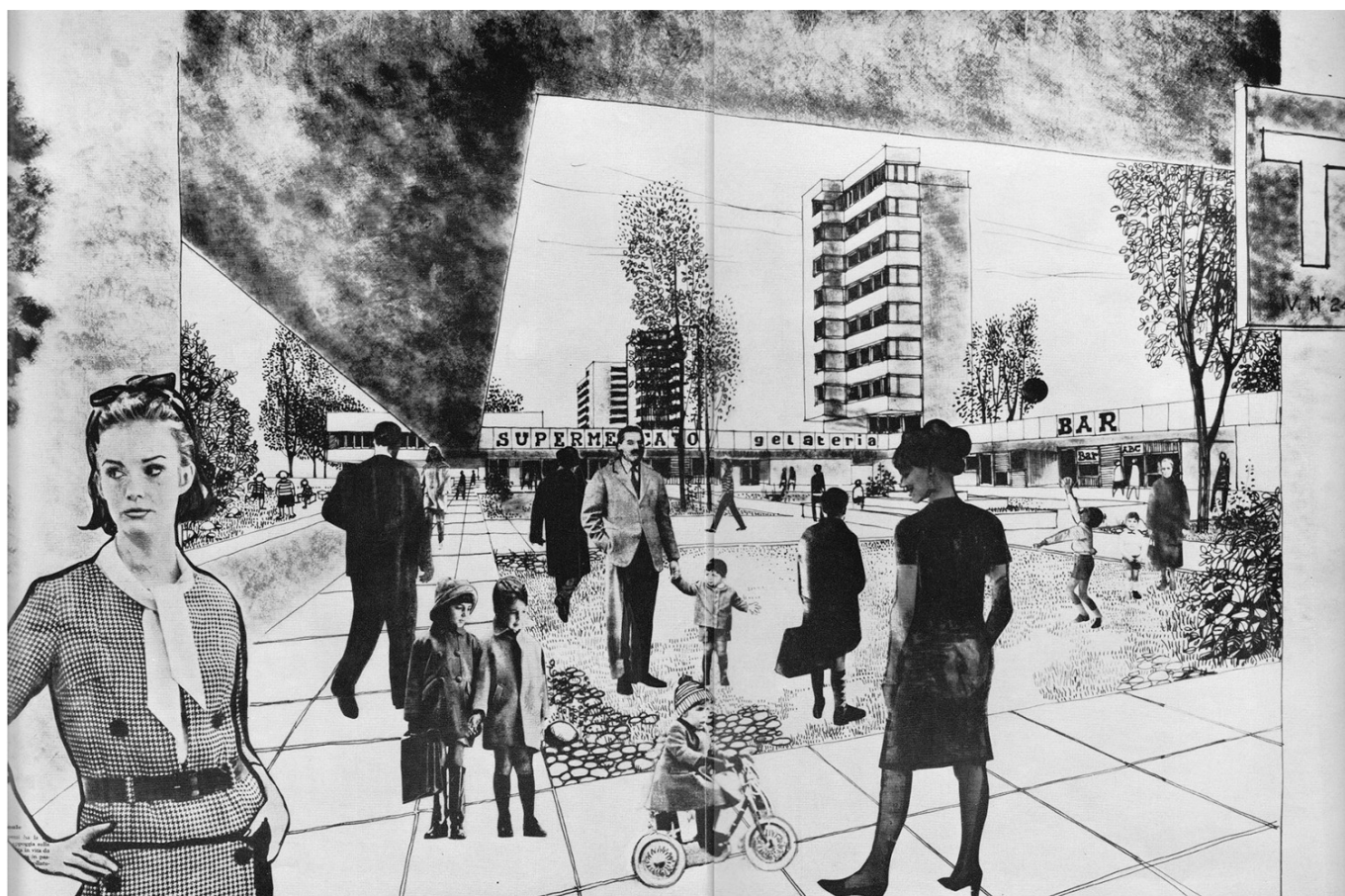
Fig. 5: progetto per il centro commerciale del quartiere Beverara, Bologna (da Comune di Bologna 1965).

Se i casi fin qui presentati raccontano storie in cui l’emergere della grande distribuzione all’interno dei quartieri 167 risulta come un elemento tardivo, indesiderato e parzialmente incongruo rispetto alle ipotesi iniziali, esistono anche casi in cui la grande distribuzione, o comunque attività commerciali più vicine agli immaginari europei e nordamericani sul rapporto tra shopping mall e civiness , entrano fin dall’inizio nei progetti per i quartieri come elemento di una sperimentazione intorno all’articolazione degli spazi collettivi. Una situazione di cui, in mancanza di studi più sistematici, è difficile valutare la frequenza. Bologna è una delle città italiane che, negli anni successivi all’approvazione della 167, interpreta gli strumenti forniti dalla legge come un’occasione per ampliare il controllo pubblico sulla produzione residenziale e sulle modalità dell’espansione urbana. Ponendosi in contrapposizione esplicita rispetto ad altre interpretazioni coeve che leggevano i piani di zona come strumenti settoriali per la realizzazione di complessi di edilizia