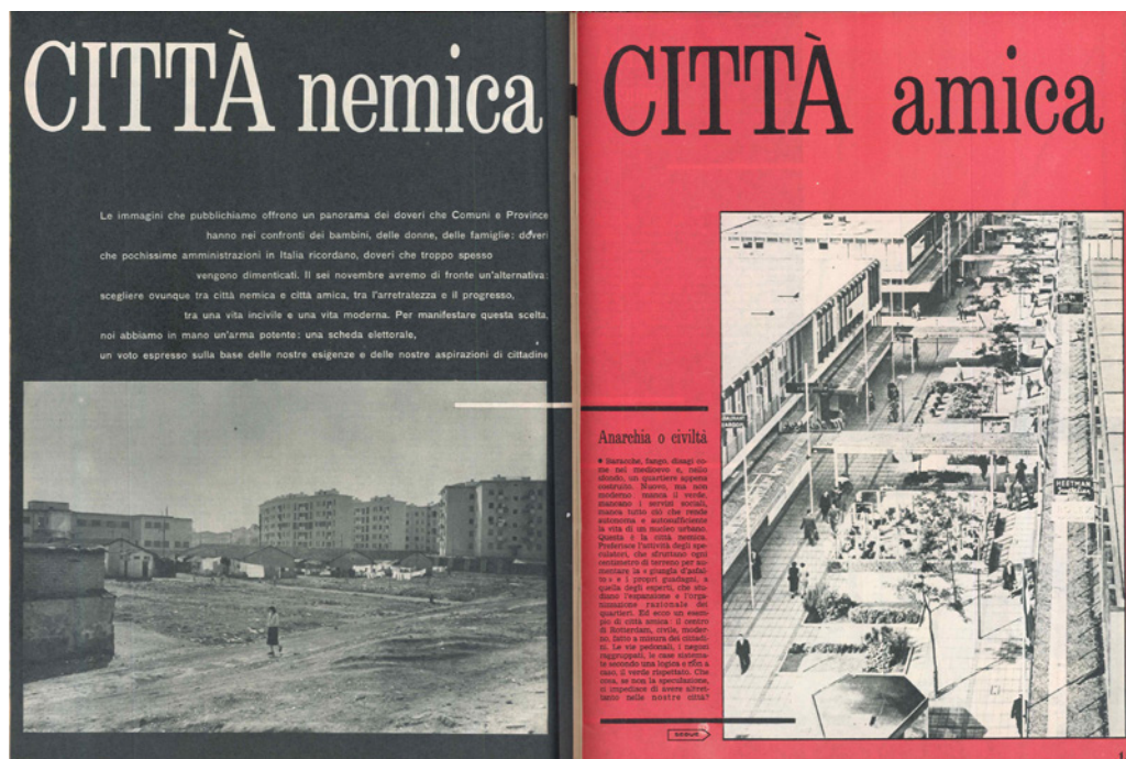
Fig. 2: Impariamo a votare per una città amica, "Noi donne", XV, 43, 30 ottobre 1960, pp. 14-15.

che progettuali e sperimentazioni sul campo. La cornice di queste esperienze è duplice ed è rappresentata da un lato dall'ingresso in Italia di un interesse per i dibattiti internazionali sull' urban design (Ferrari 2005; Mumford 2009; Avermaete-Gosseye 2021), dall'altro dalla percepita necessità di un salto di scala nella progettazione, che porta a vedere nei quartieri uno dei possibili terreni di incontro tra ricerca architettonica e dibattito urbanistico (Piccinato, Quilici, Tafuri 1962; Capuzzo 2000). Un buon osservatorio per cogliere questi elementi è rappresentato dall'applicazione, della legge 167 del 1962, uno dei provvedimenti cui, negli anni del centrosinistra, viene affidato il compito di ripensare le forme e le procedure dell' housing pubblico dopo la conclusione della stagione dell' Ina-Casa . Una stagione che puntava a rendere possibile la realizzazione di una nuova generazione di quartieri chiamati a rispondere alle mutate condizioni di un paese in piena espansione economica.