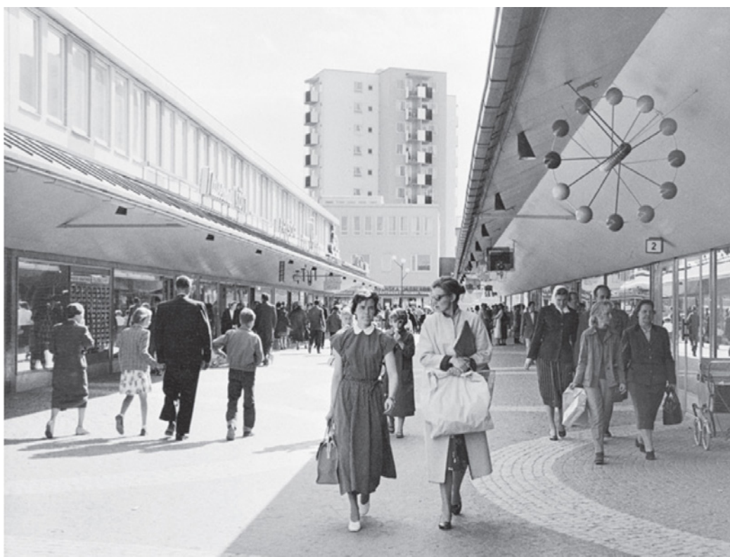
Fig. 1: il Vällingby Centrum nel 1975 (da Creagh 2011).

zialmente fondativo nei confronti di nuove forme di cittadinanza, intessendo un'alleanza particolarmente precoce tra architettura modernista e immaginari del commercio (Fig. 1) (Mattsson-Wallenstein 2010; Creagh 2011; Larsson 2020). Anche in alcune delle new towns inglesi del secondo dopoguerra, specialmente in quelle designate a partire dalla metà degli anni Cinquanta, la sperimentazione progettuale tocca la costruzione di centri civici dalla spiccata vocazione commerciale. Il caso più noto è certamente quello di Cumbernauld, pianificata da Sir Hugh Wilson ma segnata soprattutto dalla megastruttura del "Town Centre" progettato da Geoffrey Copcutt e inaugurato nel 1966, complesso multifunzionale che include una serie di luoghi pubblici e un centro commerciale multilivello e che offre un'immagine chiara della fiducia riposta dalle culture architetture, urbanistiche e amministrative del secondo dopoguerra intorno alla possibilità di costruire nuove identità civiche a partire dai rituali del consumo (Bullivant 2004; Hatherley 2012, pp. 299- 304; Gold 2006; Glendinning-Watters 2012).