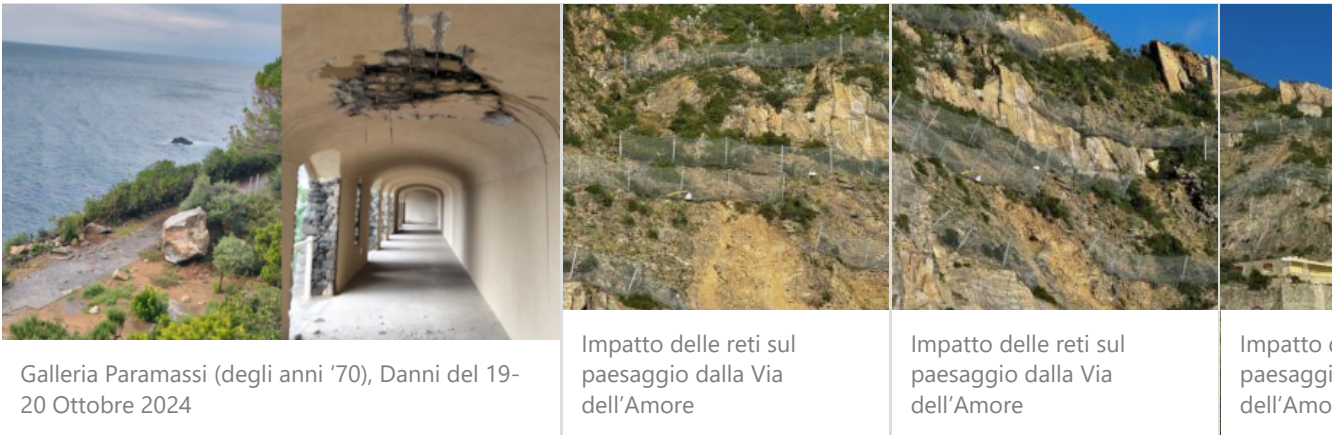
Immagine copertina: Sentiero della Via dell'Amore dopo la riapertura di Luglio 2024

Ripensare la gestione del territorio con un approccio integrato, che combini opere ingegneristiche mirate, manutenzione tradizionale e valorizzazione culturale è l'unica strada per preservare non solo questo sentiero, ma l'intero patrimonio naturale e culturale delle Cinque Terre. La magia della Via dell'amore non sta solo nel suo panorama mozzafiato, ma nella capacità di raccontare una storia di resilienza e adattamento che il tempo non deve cancellare.