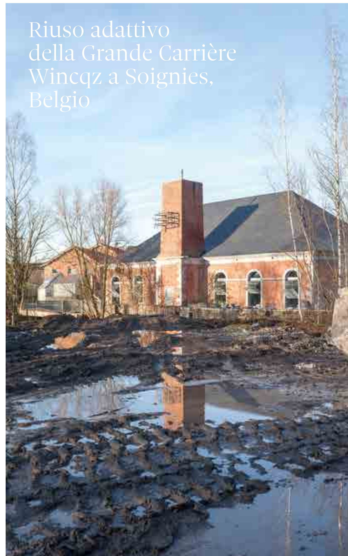
↑ The Grande Scierie as seen from the active mining site