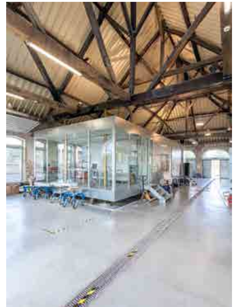
↑ Interior of the Grande Scierie with the service rooms and training offices, suspended on the foundations of the machine à scier uncovered during construction © Tra Architetti

and hired teams competing for blocks to be worked. The 1863 construction of the Grande Scierie and the installation of the cast machine à scier at the Grand Hornu, which automated the manufacturing cycle and marked the transition to true industrialisation - when mechanisation takes command, to use Sigfried Giedion's striking 1948 phrase. This moment marked the end of the Ancien Monde of criées, where maîtres competed on piecework for entirely manual tasks, and ushered in the Nouveau Monde of machinery, steam and later electricity, salaried workers, engineers and World's Fairs. The Wincqz family were the initiators, promoters and protagonists of this revolution.