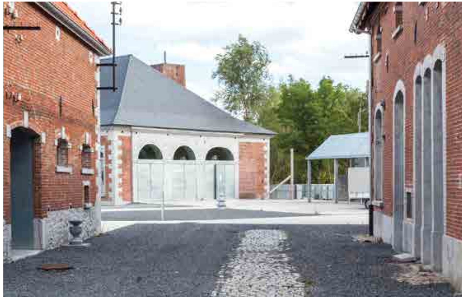
↓ The Grande Scierie seen from the pavilions reused as a cafeteria (left) and museum (right)

anni assume una patina che lo avvicina alle cromie della pierre bleue che incornicia i mattoni nelle preesistenze. Così che quando il committente ci ha chiesto di aggiungere un nuovo edificio - necessario ad ospitare nuovi macchinari a controllo numerico e ulteriori atelier di formazione - questo ha assunto la materia delle macchine e la forma di un grande blocco emerso dal suolo. Oggetto insieme meccanico e geologico, che lascia alla preesistenza di essere ancora oggi la cifra riconoscibile dell'architettura nel luogo.