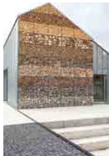
↑ Façade of the new workshop pavilion: rock library of different Wallonian stones worked in pieces / © Tra Architetti

Il riuso del patrimonio industriale è l'occasione per Toussaint Robiglio Architetti con Patrick Bribosia di lavorare a un nuovo equilibrio tra passato e futuro, che integra preservazione meticolosa dell'architettura esistente e adattamento a nuovi usi grazie a dispositivi architettonici autonomi, leggeri e rimovibili.