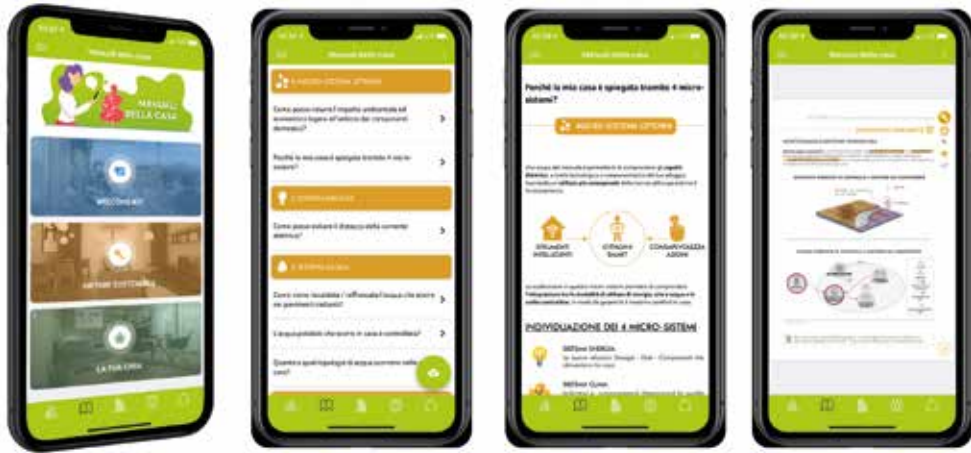
fig.2 Applicazione Uptown, 2020. Schermate dell'applicazione dedicate alla fruizione digitale dei contenuti del manuale.