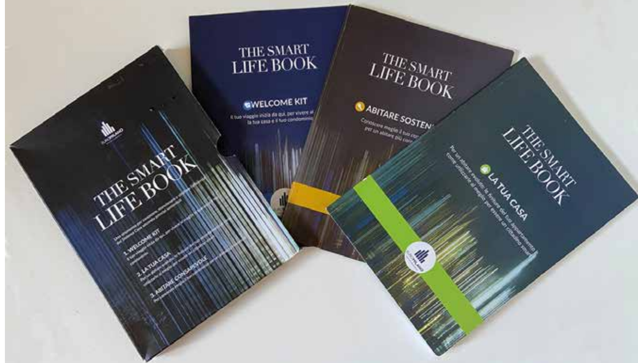
fig.3 The Smart Life Book, 2020. Rappresentazione dei tre volumi del cofanetto e un dettaglio delle rappresentazioni sistemiche.