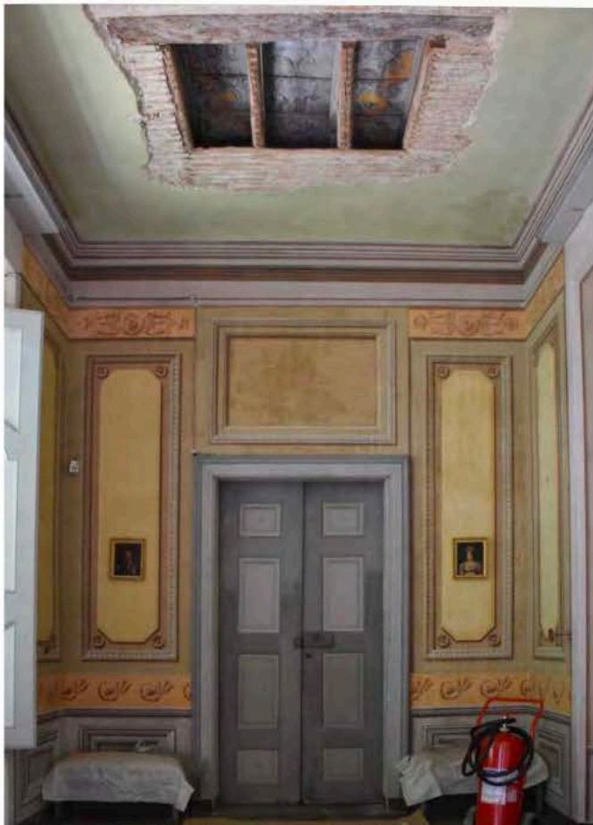
Fig. 5 Castello di Agliè, apertura nel plafone ligneo ottocentesco della Galleria dei morti , 2023. Si intravede la decorazione all'intradosso del solaio preesistente, emersa in seguito alla campagna di indagini diagnostiche condotta nel 2007 (foto D. Arpellino 2022).