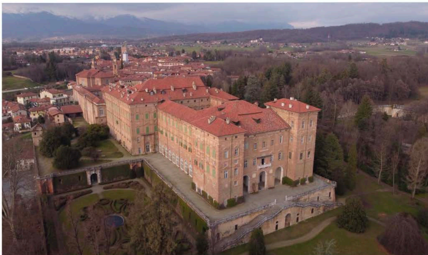
Fig. 1 Agliè, veduta del fronte sud-ovest del Castello (foto T. Vagnarelli, M. Villata 2021).

quale è possibile comprendere i mutamenti di gusto, di destinazione d'uso e di committenza susseguitisi nel corso dei secoli.