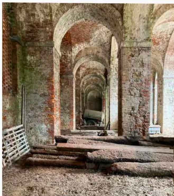
Fig. 9 Agliè, una delle campate interne del Ponte Rosso , ora utilizzato come deposito.

non risulta più idonea a sostenere il carico connesso alla presenza della strada carrabile sull'impalcato. Inoltre, nel testo si sottolinea anche la presenza superficiale di diverse forme di degrado, dovute principalmente alle numerose infiltrazioni provenienti dalla strada all'esterno del muro di cinta, causate da un problematico deflusso delle acque meteoriche. Oltre ai mattoni ormai visibilmente ammalorati, la presenza costante di una notevole quantità di acqua all'interno della muratura, soggetta a fenomeni di gelo e disgelo, ha innescato anche il depauperamento della malta e lo sfarinamento dei laterizi in ampie zone. Presa coscienza dello stato di fatto, l'intervento, condotto tra il maggio e il novembre del 1979, si concentra sul consolidamento degli elementi architettonici, a partire dal ripristino del viadotto stradale lungo il muro di cinta del parco. In un secondo momento, prevede il rinforzo della struttura tramite l'inserimento di tiranti – di cui oggi si osservano le piastre di ancoraggio in facciata – e un successivo getto di una soletta in c.a., con spessore pari a 25 cm, all'estradosso delle volte per il sostegno della strada interna ed esterna al parco.