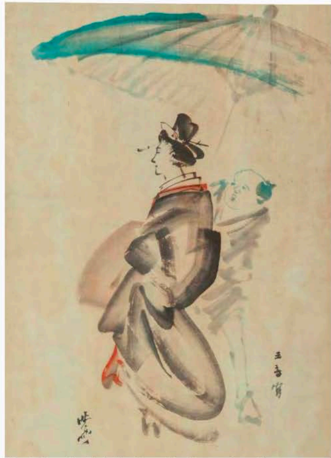
Fig. 6 Castello di Agliè, dettaglio di una tela raffigurante una donna giapponese con parasole e servitore. L'opera è menzionata nell' Inventario del 1908 (Catalogo generale dei Beni Culturali, ICCD14677408_CDA_DIG02876).