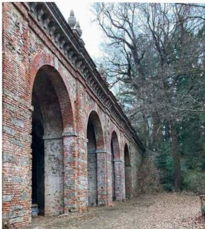
Fig. 8 Agliè, il fronte principale del Ponte Rosso affacciato verso il parco del Castello.