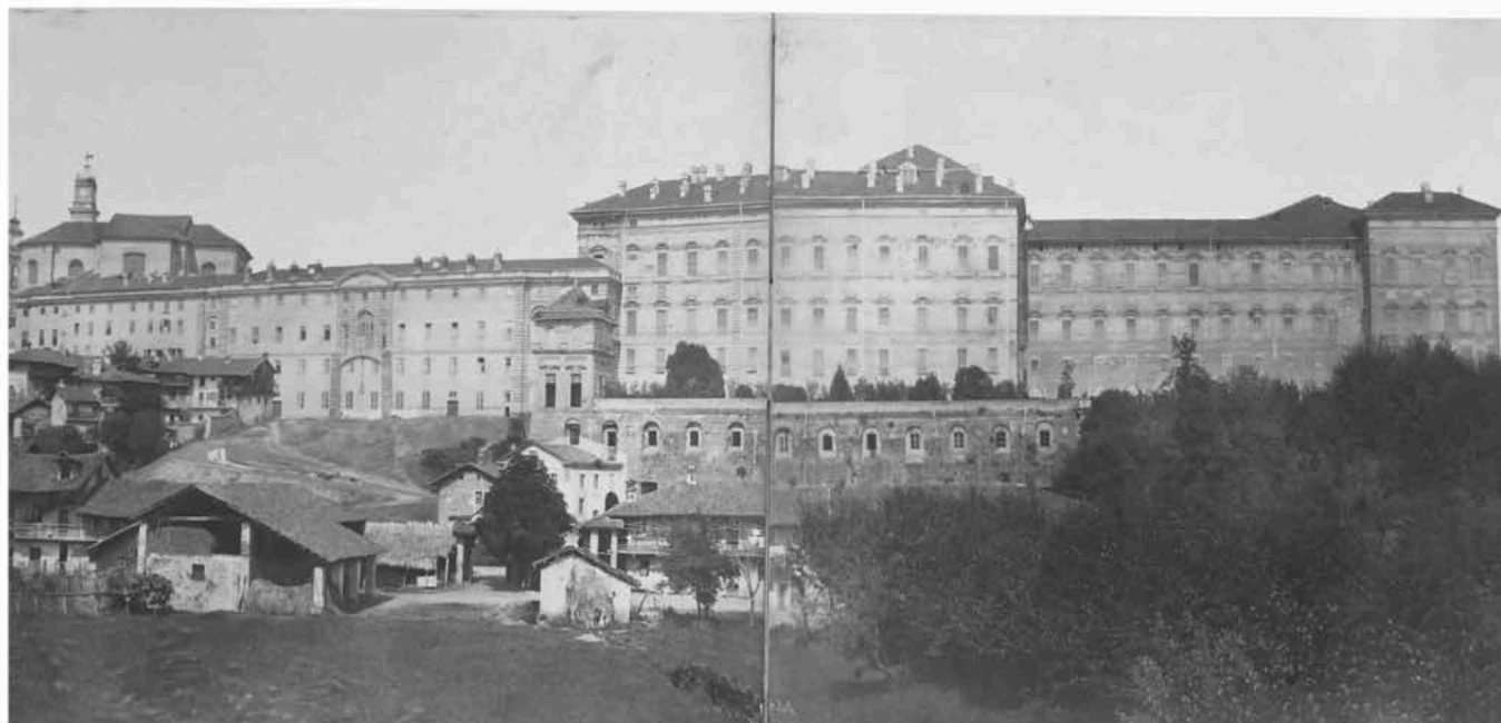
Fig. 2 Agliè, il fronte ovest del Castello di in una veduta di inizio '900 (Politecnico di Torino, Biblioteca Centrale di Architettura, Sezione Libri Rari, Vedute del Castello di Agliè , raccolta fotografica, s.d.).