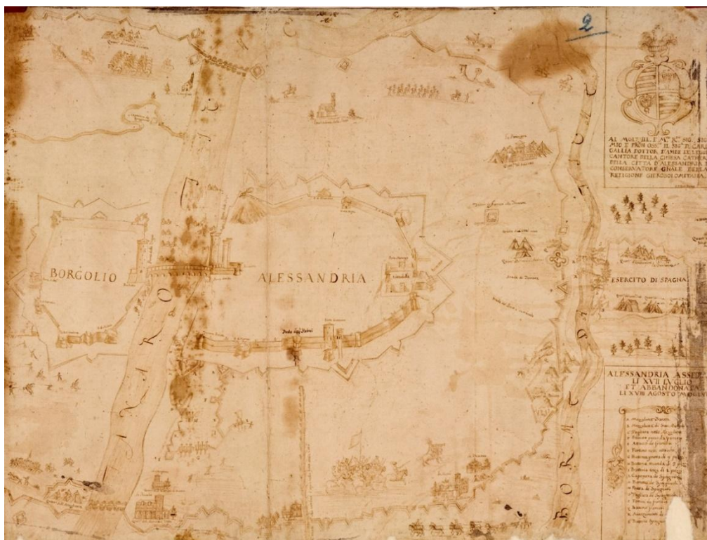
Fig. 1- G. F. Pert, Alessandria assediata li XVII luglio et abbandonata li XVIII agosto MDCLVII , s.d. post 1657 (ASAI, ASCAI, serie III, 2262/2)