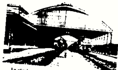
La stazione di Pistoia nel primo dopoguerra

La struttura è periodicamente aperta al pubblico e visitabile con visite guidate e previa prenotazione.