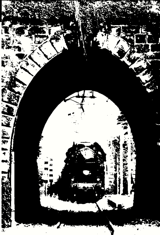
Castagno, 741.120 in servizio sulla Porrettana