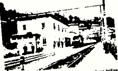
La stazione di Corbezzoli al tempo della trazione trasse