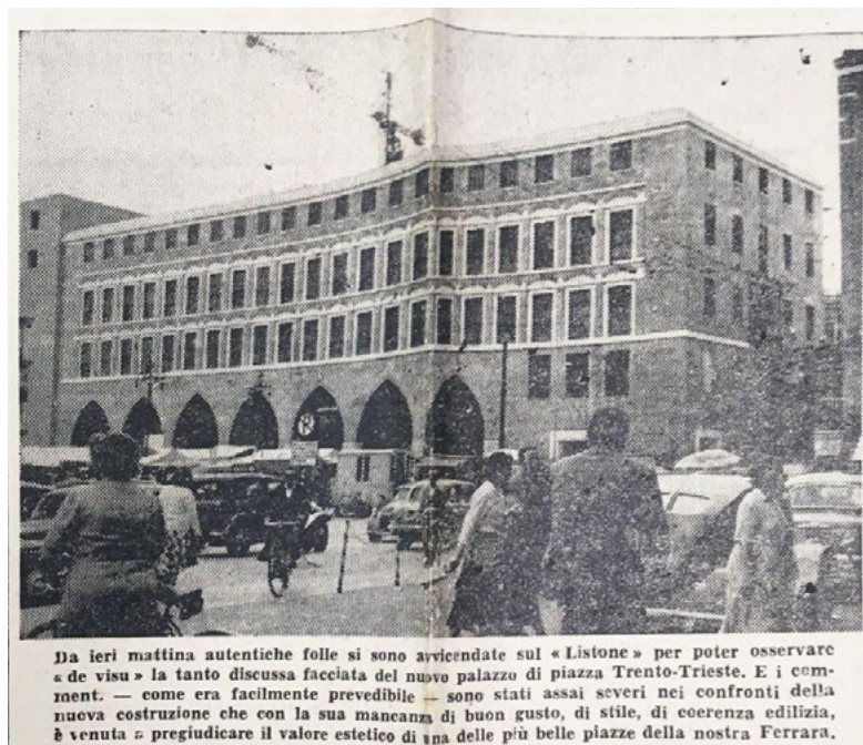
3. Lo svelamento della facciata alla cittadinanza [Da ieri mattina 1956]. BST UniFi, Piacentini, b. 239.

e del Ministero, alla fine del 1954 il cantiere è avviato e, il 30 giugno 1956, senza cerimonie ufficiali, la cittadinanza può finalmente osservare la facciata del Palazzo della Ragione [Da ieri mattina 1956] (Fig. 3).