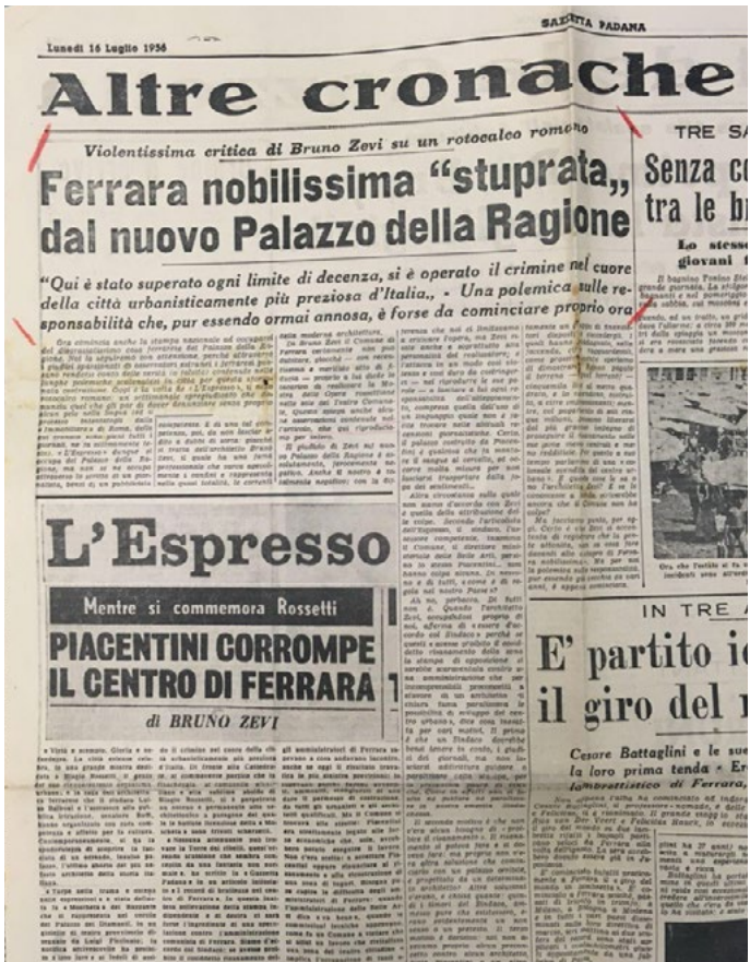
5: L'articolo di Zevi pubblicato sulla «Gazzetta Padana». [Ferrara nobilissima "stuprata" 1956]. BST UniFi, Piacentini, b. 240.

sollevando quindi l'amministrazione comunale comunista da ogni responsabilità, per la redazione della «Gazzetta Padana» è proprio il Comune a essere colpevole, per aver promosso – ormai quasi dieci anni prima – una «colossale svendita del centro urbano» [Ferrara nobilissima "stuprata" 1956] (Fig. 5).