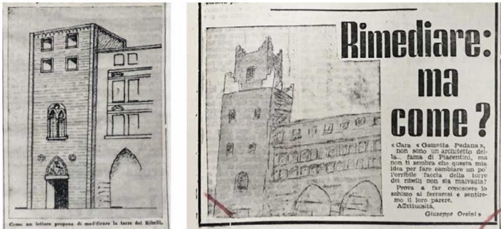
4: Proposte dei lettori per la Torre dei Ribelli [Il Comune intendeva 1956; Orsini 1956]. ASCFe, CA, b. 78; BST UniFi, Piacentini, b. 240.

prospettive interessanti sulle preferenze di un pubblico non specialista, che non si riconosce nell'architettura «moderna» proposta da Marcello Piacentini, ma predilige un'immagine pittoresca, che rimanda a un Medioevo idealizzato. Un esempio significativo, a questo proposito, è la torre disegnata da un lettore nella Gazzetta Padana del 14 agosto 1956, che presenta numerosi elementi storicisti, tra cui formelle, archetti pensili, sestri acuti, bifore e risalti in corrispondenza delle cantonate. Simili considerazioni possono essere fatte anche per la proposta dall'architetto locale Giuseppe Orsini [Orsini 1956] (Fig. 4).