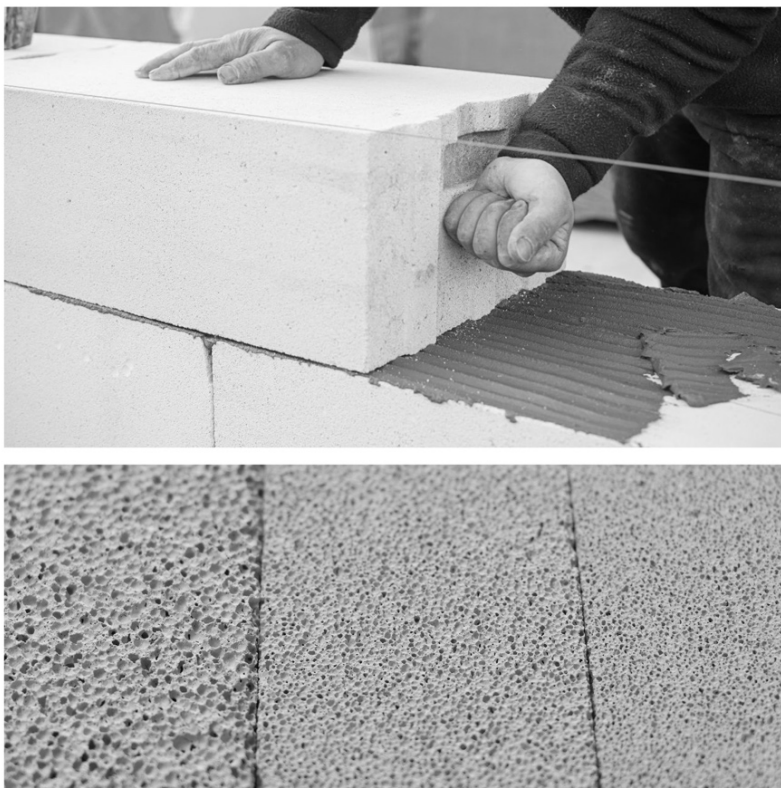
Figura 1. Posa di un blocco in CAA e confronto tra blocchi con porosità differente.

dovuta al contatto con l'ambiente basico (pH superiore a 7) indotto dalla miscela di calce aerea e acqua. Tale reazione provoca la produzione di bolle di idrogeno; le quali attraversando il composto portano a un aumento del volume (fino al 500%) e a una riduzione del peso (compreso tra ca. 300 e 900 kg/m 3 a seconda del mix-design ).