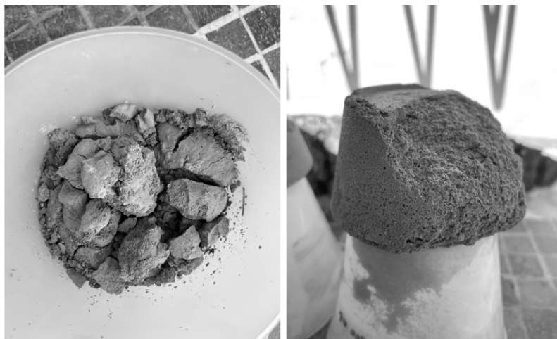
Figura 2. Frantumazione (sinistra) e disgregazione (destra) dei campioni sviluppati nel corso della prima campagna sperimentale.

La prima campagna ha lo scopo di comprendere la relazione tra diversi tipi di leganti - cemento Portland (PC), cemento naturale (NC) e calce idraulica naturale (NHL) – con il cocciopesto e la polvere di alluminio (utilizzata come agente aerante). In questo caso, il cocciopesto è impiegato come sostitutivo della sabbia silicea. Le attività sperimentali hanno sviluppato 17 campioni: nessuno dei quali ha soddisfatto i requisiti prestazionali come mostrato nella Figura 2.