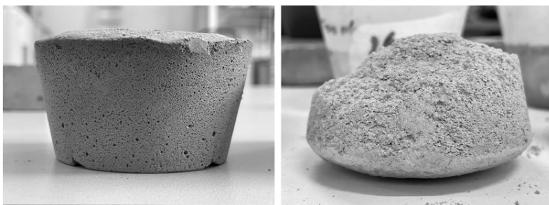
Figura 3. Limitata espansione (sinistra) e disgregazione (destra) dei campioni sviluppati nel corso della seconda campagna sperimentale.

La seconda campagna ha reintrodotta alcune sostanze presenti nella miscela di CAA e utilizza una combinazione di leganti. Più nel dettaglio, i 20 nuovi campioni sono realizzati con una frazione di chamotte (50%) e sabbia silicea (50%) e sono suddivisi in due gruppi di leganti: cemento Portland + cemento naturale (PCN) e cemento Portland + calce aerata (PCA). Come nella prima fase, i nuovi campioni non hanno soddisfatto gli obiettivi prefissati. I problemi evidenziati sono di due tipi (Figura 3): limitata espansione nei campioni PCN e disintegrazione per i campioni PCA. Un'analisi più dettagliata ha rivelato che i problemi sono riconducibili al cocciopesto. Esso comprende una frazione di silice (quarzo) meno reattiva rispetto alla sabbia e, dal punto di vista granulometrico, si presenta come una polvere le cui particelle sono più piccole di quelle dei leganti. Questa caratteristica non consente ai leganti di funzionare correttamente e sviluppare le resistenze meccaniche.