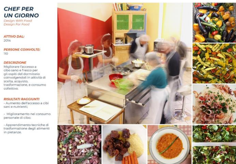
Figura 3. Chef per un Giorno. Le fasi, gli alimenti, i piatti.

Chef per un Giorno è un workshop permanente di Design With Food , attivo dal 2014, che favorisce l'accesso al cibo qualitativamente adeguato, attraverso l'esperienza diretta della trasformazione della materia prima. Le persone coinvolte non solo hanno cucinato il cibo ma hanno anche fatto pratica di autodeterminazione, spesso negata nei servizi per persone senza dimora. Scegliendo il menù e gli ingredienti, hanno comprato o recuperato gli alimenti, gestendo un budget definito e limitato, condividendo pasti con gli altri ospiti della struttura. I partecipanti hanno vissuto momenti conviviali e socializzanti, capaci di contrastare i luoghi comuni sulla homelessness e di sospendere, anche solo temporaneamente, le condizioni critiche legate alla situazione di fragilità. Le testimonianze raccolte mostrano che la povertà alimentare è non solo impossibilità ad accedere a risorse alimentari dignitose, ma si configura anche come impossibilità, inabilità e indebolimento delle capacità di provvedere personalmente ai propri bisogni (Figura 3).