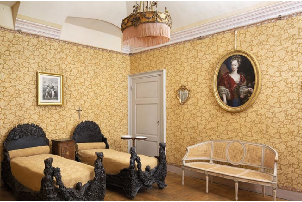
5: Stanza della principessa Maria Clotilde.

prevedeva uno spostamento in ferrovia fino a Fossano, e da qui a San Michele Mondovì in vetture di diverso tipo; una char a baldacchino tirata da 4 cavalli per i principi e per il generale, un calesse di traghetti a due cavalli d'affitto per il dottore e il precettore, un furgoncino alla polacca e un omnibus per il resto della comitiva, come ricordato nel fascicolo che racchiude la documentazione inerente alla partenza della corte dei principi e delle principesse per Casotto 14 .