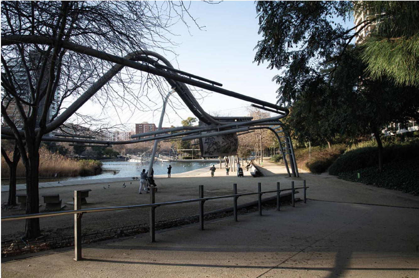
Parque Diagonal Mar, Barcellona. Foto Roberta Sassone, febbraio 2023.