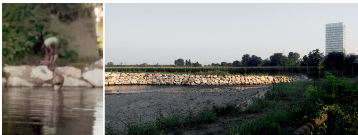
I bagnanti del Lambro nella torrida estate 2015.

Per l'Espresso, nel 1975 al Parco Lambro “finisce l'era del pop, comincia l'era del freak”: il fiume, per una volta, al centro.