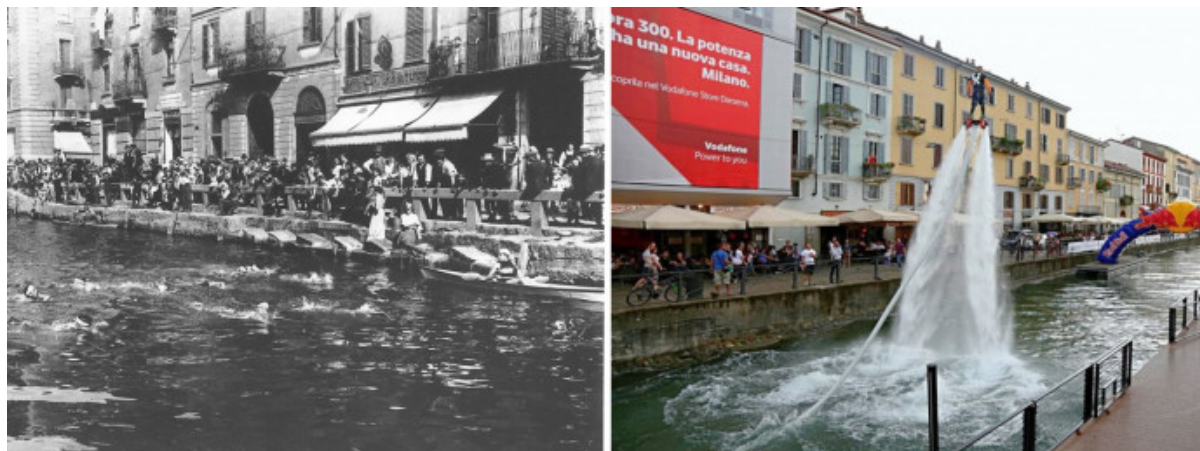
Una gara di nuoto sul Naviglio Grande negli anni '20 e un'esibizione di flyboard nel corso della manifestazione StraNavigli, 2015.