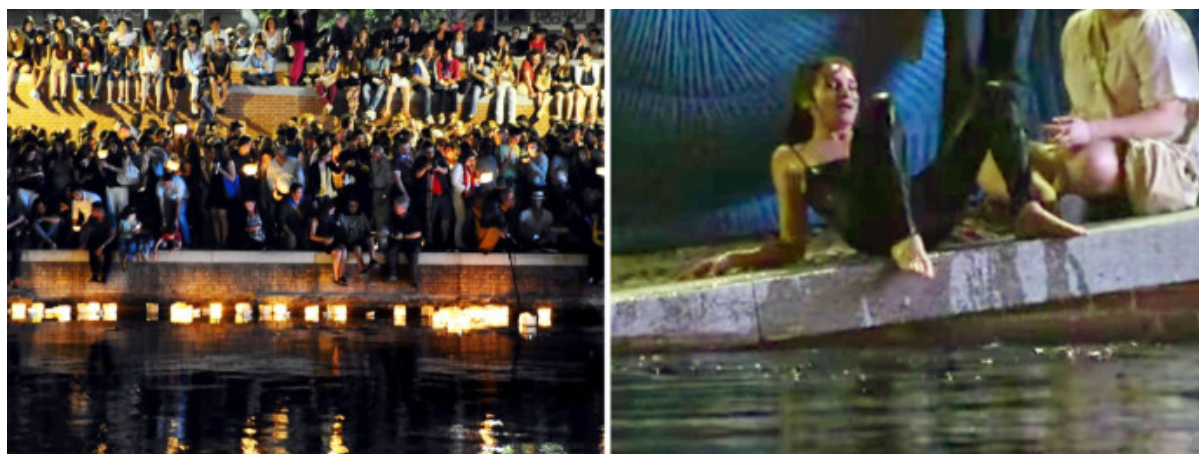
La Darsena di Milano sovraffollata durante la Notte delle Lanterne, il 24 giugno 2015.