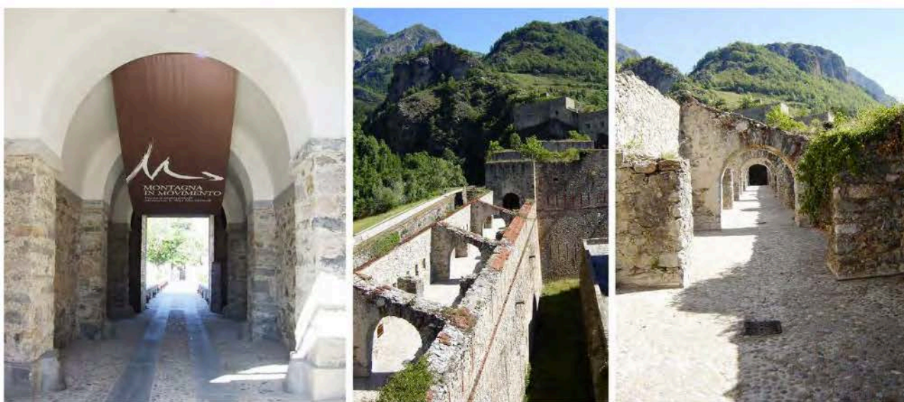
2: L'ingresso al Museo Montagna in Movimento e i percorsi esterni sulle mura.

Oggi il Forte di Vinadio è sede di eventi e manifestazioni culturali, musicali e sportive, ospita il Museo Montagna in Movimento e il suo percorso multimediale che racconta la storia delle Alpi Marittime, la mostra permanente multimediale Messaggeri alati dedicata alla colombaia militare, le postazioni di realtà virtuale Vinadio Virtual Reality e gli itinerari Family&Kids Friendly Mammamia che Forte . Ospita inoltre l'opera permanente "Circle" dell'artista inglese Richard Long, storico esponente della Land Art e costituisce una delle tappe del percorso artistico transfrontaliero VIAPAC, via per l'arte contemporanea , che attraverso l'installazione Giants dell'artista scozzese David Mach all'ingresso del forte celebra i giganti Ugo di Vinadio. Tali iniziative evidenziano come il riconoscimento di valori storico-culturali e identitari possa essere promosso e rinnovato anche attraverso la creazione di nuove relazioni con il contesto e l'attribuzione di nuovi significati attraverso l'arte contemporanea.