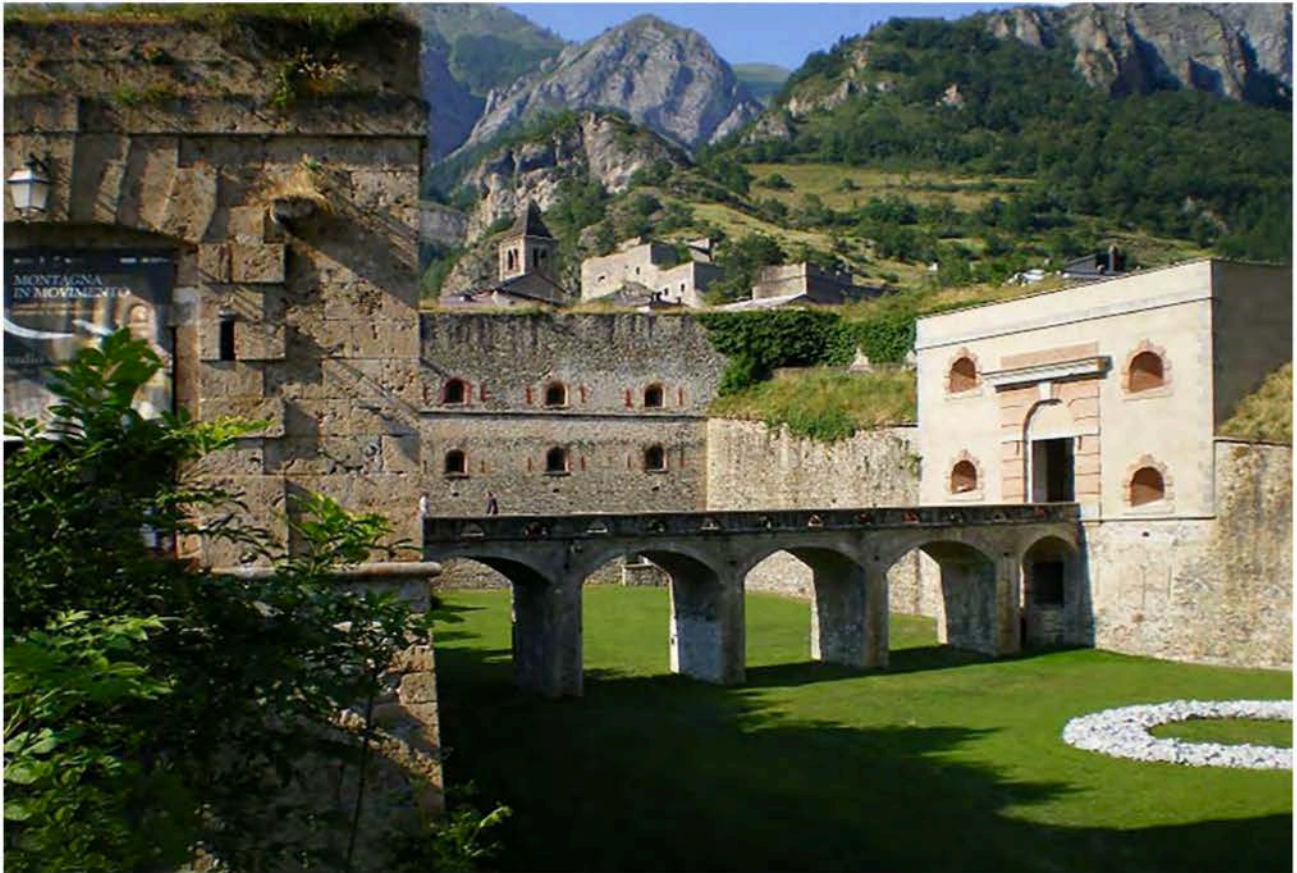
3: Il Forte di Vinadio a seguito della sua rifunzionalizzazione in museo.