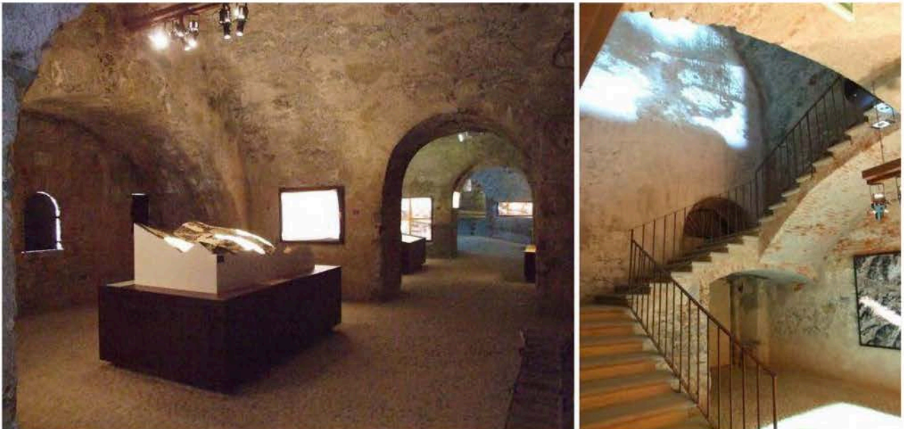
4: Il Museo "Montagna in Movimento" e il suo percorso multimediale allestito all'interno del Forte di Vinadio.