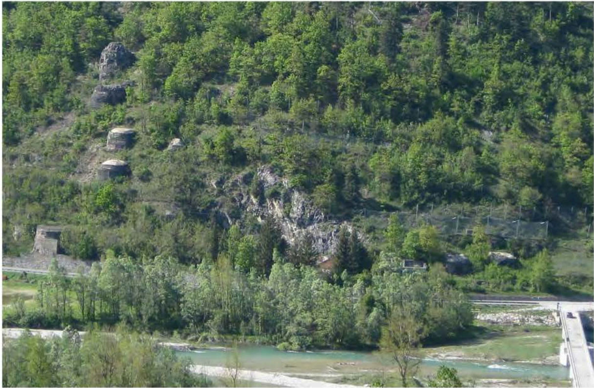
5: L'Opera n. 5 di Moiola si sviluppa lungo la strada di fondovalle in direzione Demonte mimetizzandosi sul costone roccioso.

culturale integrato teso alla valorizzazione dei manufatti nonché alla salvaguardia del contesto ambientale e naturalistico di appartenenza attraverso strategie di intervento compatibili con la flora e la fauna.