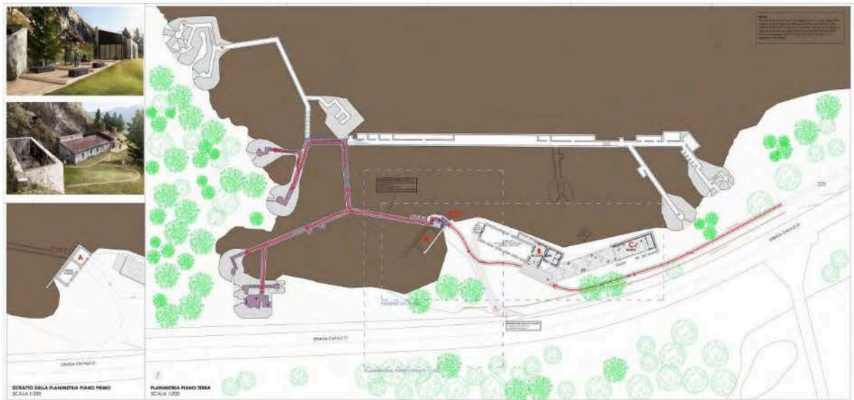
6: Il progetto di restauro e valorizzazione dell'Opera n. 5 prevede la musealizzazione e la fruizione del sistema di gallerie sotterranee.