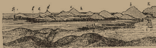
Veduta generale dei monti calcarei dei dintorni di Alghero. A. La Marmora, Voyage en Sardaigne.