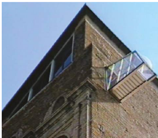
fig. 4 - Fotogramma dal film Castello di Rivoli. Lavori di restauro di Giulia D'Agnolo Vallan (Italia 1984).

dei diversi elementi del sito e dei lavori realizzati. In questo senso abbraccia la logica del diario di cantiere, seguendo il corso del giorno in cui viene installato lo sporto panoramico, una delle principali dichiarazioni di modernità dell'intervento di restauro in corso.