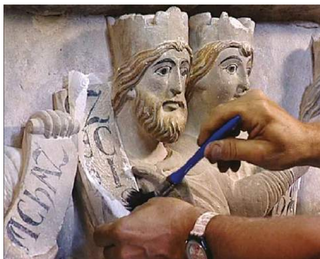
fig. 3 - Fotogramma dal film Santa Maria di Vezzolano. Il restauro dello Jubé di Fedele Aula (Italia 1998).

Il ritmo del film è scandito da successioni musicali d'osservazione delle attività, dalla voce fuori campo su panoramiche esterne e interne, dettagli, ritratti. La narrazione si caratterizza dalla scelta di usare una giornata in particolare come dispositivo di scoperta