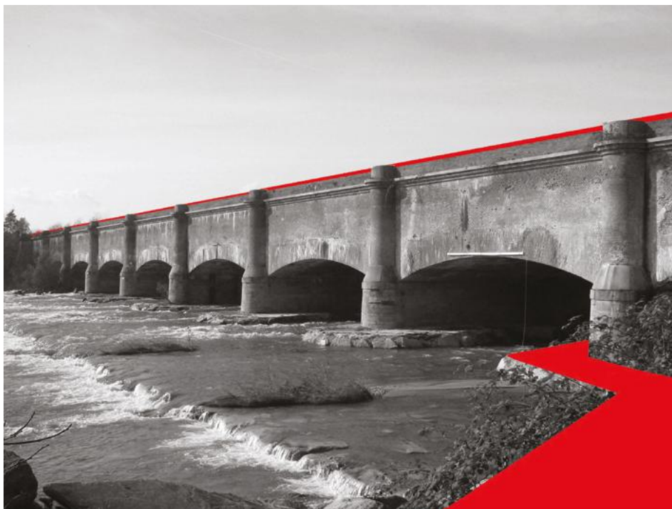
Figura 5: El puente-canal sobre el río Dora Baltea en Saluggia: simulación del recorrido del carril bici Canale Cavour. (C. Ocelli, R. Palma)