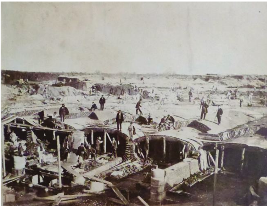
Figura 4: Sifón bajo el río Sesia: la obra [Ministero delle Finanze. Direzione Generale del Demanio. Canale Cavour e Diramatori, Canale Cavour, in Archivio Storico delle Acque e delle Terre Irrigue (Novara)]