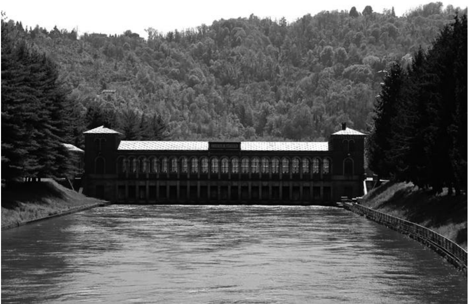
Figura. 1: Canal Cavour. Edificio toma de agua del Po. Chivasso (Turín) (C. Ocelli)

La construcción del Canal Cavour se realizó en apenas tres años (1862-1865) y se podría decir que contó con la aportación de toda la población local del territorio que vivió la enorme obra como un hecho identitario, en el que pusieron sus esperanzas de futuro. La excepcionalidad de esta obra es atestiguada también por la amplia difusión a nivel mundial que tuvo el proyecto, tanto en su fase de diseño, como durante las obras y el resultado final, así como de su refinado sistema de gestión del agua. El estudio de documentos y publicaciones internacionales entre los siglos XIX y XX del siglo pasado nos ha permitido destacar y poner en valor este importante aspecto del canal.