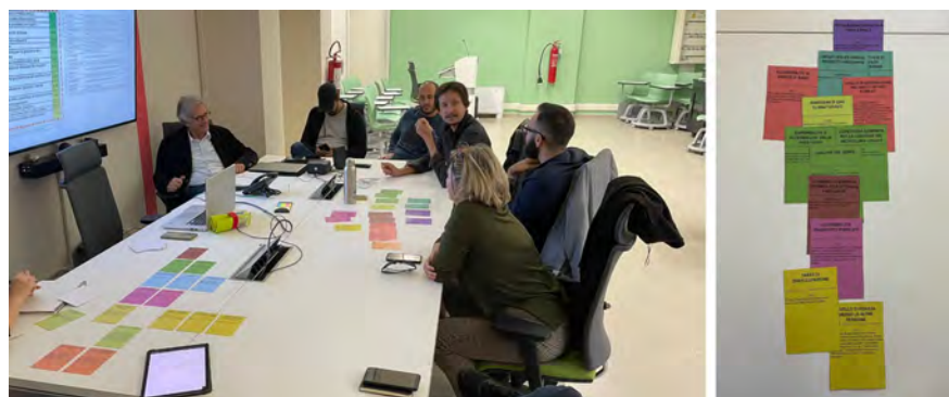
Fig. 2 - Seconda parte del workshop per la selezione degli indicatori per la dashboard (sx) e selezione finale degli stakeholder (dx) / Second part of the workshop to select indicators for the dashboard (left) and final selection of stakeholders (right).

The “priority” indicators were selected through an online questionnaire, which collected 24 responses from the actors present. Based on the first selection, a second skimming and validation process was carried out in an in-person workshop through the playing card method (Figueira and Roy, 2001). The most important indicators were selected in terms of climate-altering emissions, quantity and quality of green spaces, waste generation and collection, air quality, and microclimate. The third