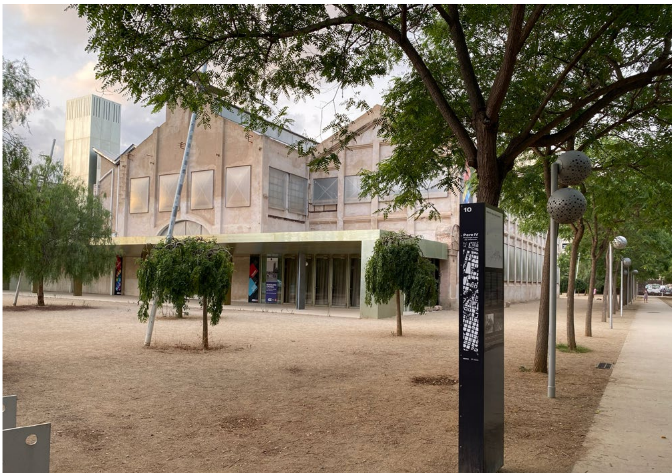
Figura 4. Il nuovo portico strutturato lungo l'asse di Carrer de Pere IV e concepito come elemento di transizione tra esterno e interno (C. Di Felice, 2021).

Centrale nella definizione del progetto architettonico di Oliva Artès dello studio BAAS Arquitectura 13 è la presenza, da un lato, della storica carrer de Pere IV, che corre in parallelo lungo il lato lungo dell'edificio, e, dall'altro, del Parc del Centre del Poblenou dove si inserisce. La scelta dei progettisti incaricati di ripristinare parte del tracciato del carrer de Pere IV, non originariamente considerato nel progetto di Jean Nouvel per il Parc de el Poblenou, ha fatto sì che attualmente si configuri sia come memoria storica, che come principale percorso pedonale di attraversamento di questa parte del parco e, al contempo, di accesso al museo, permettendo di stabilire una maggiore relazione fra museo e due parti del quartiere che non dialogavano tra loro (Figura 5).