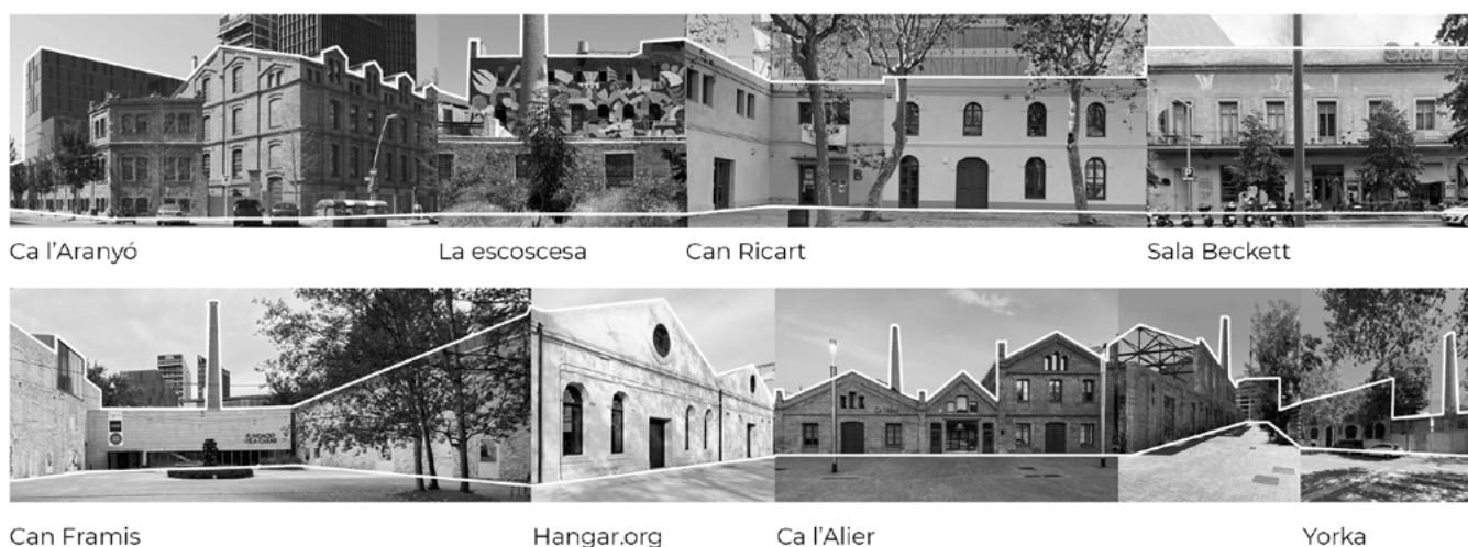
Figura 8. Prospetti degli edifici ex industriali riconvertiti incontrati lungo itinerari a piedi svolti nel periodo di ricerca sul campo (el. C. Di Felice).

facendo riferimento in questo caso agli spostamenti più piccoli, ma forse più importanti, i movimenti che le persone compiono nel quotidiano e che le mettono in contatto con la vita del loro quartiere. Dall'altro lato, la presenza del portico facilita le interazioni sociali e gli usi informali da parte della comunità del quartiere, svincolandosi dall'attività museale (attività sportive, passeggiate, chiacchiere informali ecc.) (Figura 6). Nei momenti di apertura al pubblico, invece, l'architettura esterna incuriosisce i passanti e gli utenti del parco, seguendo un movimento dall'esterno verso l'interno agevolato dai percorsi e dalla visibilità del portico d'ingresso. Al contempo, il fatto che lo spazio esterno attorno al museo sia racchiuso e protetto dalla recinzione verde lo rende uno spazio chiaramente definito e riconoscibile dalle persone, nonché protetto fisicamente e visivamente, garantendo privacy e senso di sicurezza, qualità molto necessarie in un ambiente urbano. Esso si presta pertanto ad attività interpretabili come estensione della vita all'interno dell'edificio del museo o come spazio aggiuntivo e complementare in