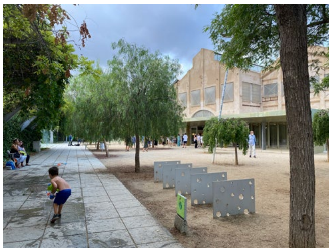
Figura 6. Lo spazio antistante il museo favorisce le interazioni sociali del quartiere (C. Di Felice, 2021).