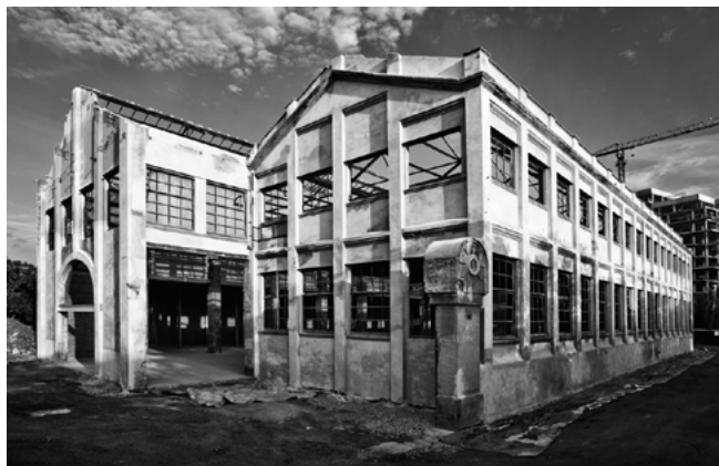
Figura 5. L'esterno della fabbrica prima dell'intervento di Baas Arquitectura (C. Di Felice, 2021).

e superfetazioni aggregate all'edificio nel corso del tempo. La conformazione e la relazione visiva con l'esterno consentono permeabilità fra spazio espositivo e spazio di ingresso/accoglienza. Per quanto riguarda l'organizzazione interna degli spazi, la navata centrale viene lasciata completamente libera, consentendo flessibilità a seconda del tipo di evento/attività temporanea realizzato, che varia da convegni, workshop, spettacoli teatrali a mostre temporanee. Il progetto risolve l'intervento con un solo gesto, ossia inserendo nella