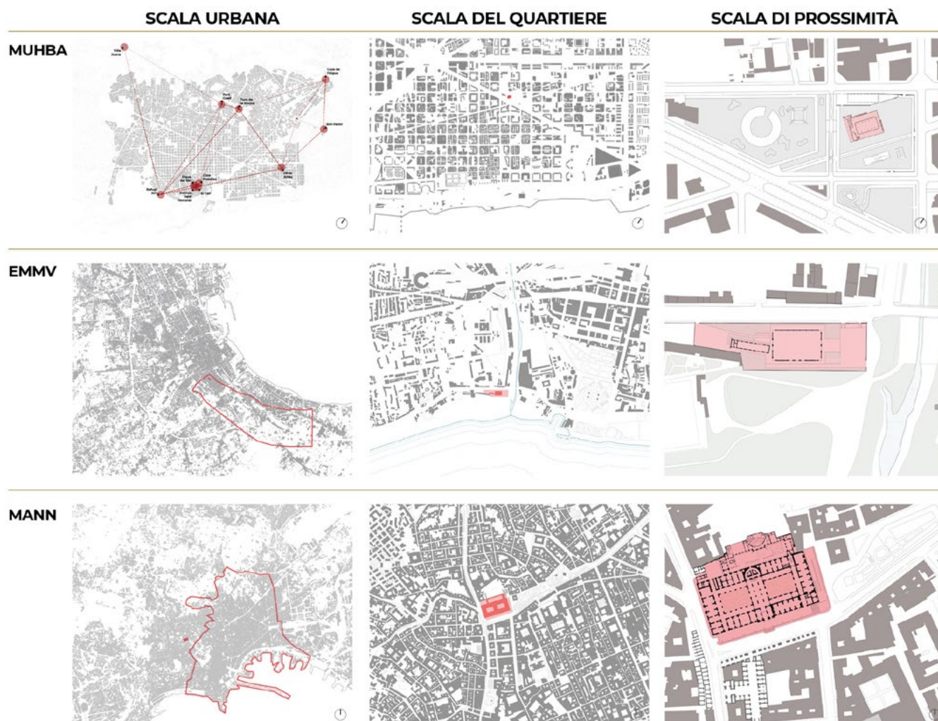
Figura 1. Esempio di analisi multiscala applicata ai tre casi studio di ricerca, tra cui il MUHBA (el. C. Di Felice).

Il presente contributo nasce a partire dallo studio del progetto del MUHBA Oliva Artés nell'ambito di una ricerca di dottorato in Beni Architettonici e Paesaggistici del Politecnico di Torino 2 , che indaga i nuovi spazi museali urbani e come il museo possa rivelarsi un agente dinamico nei processi di trasformazione della città, esaminando casi studio europei attraverso l'uso di un metodo quali-quantitativo. In particolare, i casi studio diventano strumento per un'interpretazione del fenomeno nel suo contesto di vita reale e dei processi di trasformazione che si svolgono nella città contemporanea. Di conseguenza, ciascun caso studio è stato approfondito attraverso un'analisi delle fonti storico-archivistiche e iconografiche, supportata da un periodo di lavoro sul campo, basato su un'indagine empirica e interviste alle principali figure professionali coinvolte in questo processo, approfondendo il rapporto tra luogo e pratiche di vita.