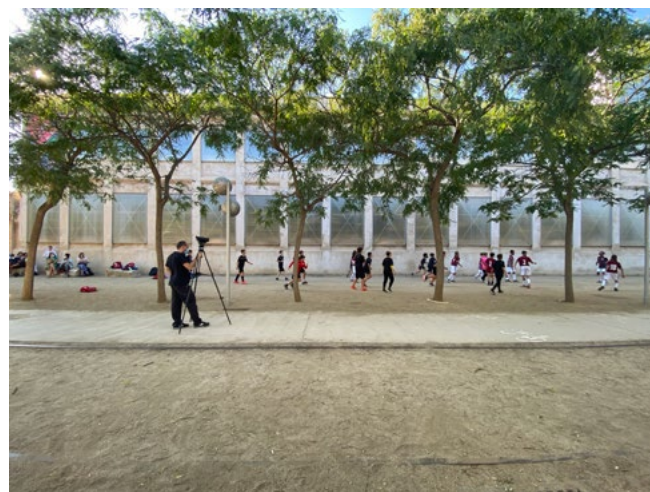
Figura 7. Attività esterne correlate all'inaugurazione della mostra "El futbol i la construcció d'identitats" del 2021 (C. Di Felice, 2021).

navata centrale un unico pannello disposto ad anello che separa il perimetro esterno al pannello stesso, dedicato ad accogliere lo spazio espositivo sulla storia urbana e contemporanea di Barcellona, dallo spazio centrale. La collezione esposta nel corridoio che si viene a creare lungo il perimetro è dedicata alla storia urbana più recente della città fino ad oggi ed è costituita principalmente da pannelli esplicativi, distribuiti verticalmente sul pannello ad anello, mappe storiche, fotografie e alcuni oggetti rappresentativi del passato industriale dell'area.