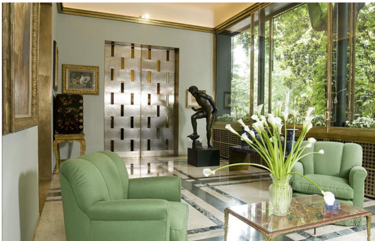
Figura 4. La veranda di Villa Necchi Campiglio, Milano.