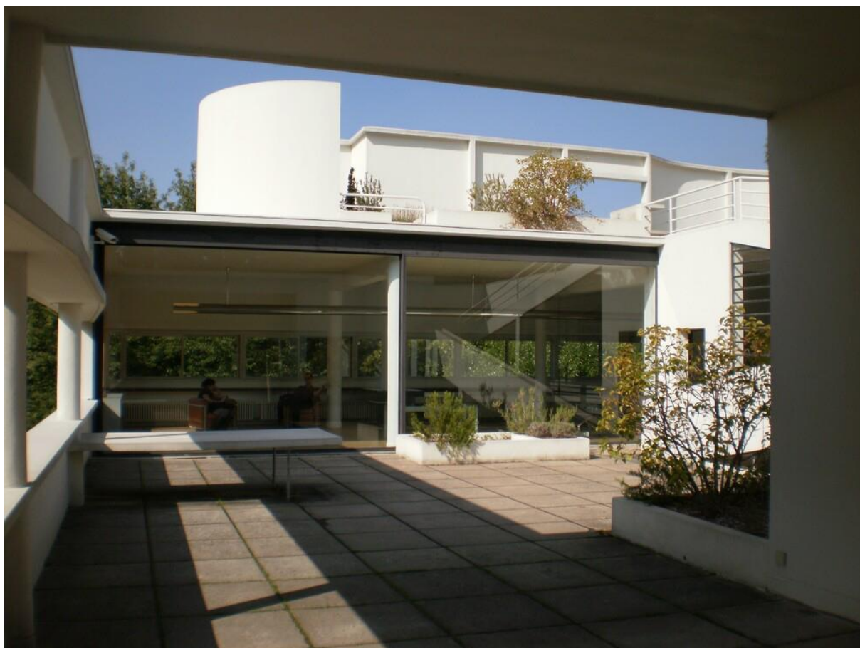
Figura 2. Villa Savoye, Poissy..