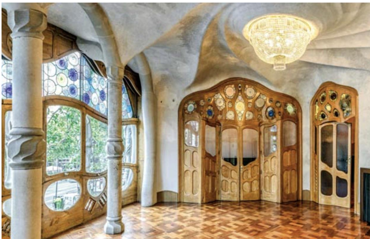
Figura 1. Il piano nobile di Casa Batlló, Barcellona.