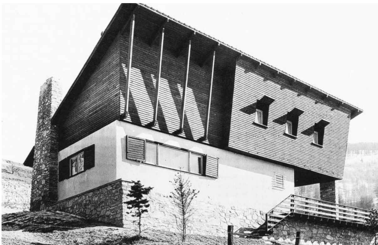
Figura 3. Veduta del prospetto principale di Villa Marocco (In Mario Cereghini, Costruire in montagna. Architettura e storia , 1956, p. 340).

lasciando in ombra il tema della residenza. Solo negli ultimi anni, dal 2000, il Ministero dei Beni Culturali, e in particolare la Direzione Generale Creatività Contemporanea, ha intrapreso un'attività di censimento delle architetture del Secondo Novecento [15, Direzione Generale Creatività Contemporanea] su tutto il territorio nazionale mettendo a punto sette criteri di qualità di tipo sia critico che qualitativo per selezionare opere di interesse storico-artistico e tentare di sanare quella carenza di conoscenza ai fini della valorizzazione e della conservazione. Si tratta di un'operazione importante, in costante aggiornamento, che nell'ultimo periodo ha subito una particolare accelerazione, e che consente anche di riportare alla luce la memoria di opere che sono andate perdute come nel caso di Villa Marocco [Figura 3], che arricchiva il territorio di Sauze d'Oulx. Rientra nella categoria 'ville e case unifamiliari' ed è stata progettata da Gino Levi Montalcini e Paolo Ceresa nel 1947.