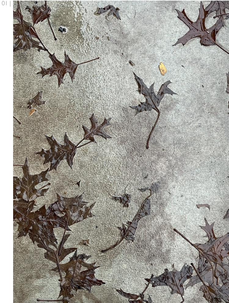
01 | Natura morta – Andrea Campioli, 2024

"Foglia, che lieve a la brezza cadesti sotto i miei piedi, con mite richiamo forse ti lagni perch'io ti calpesti. Mentr'eri viva sul verde tuo ramo, passai sovente, e di te non pensai; morta ti penso, e mi sento che t'amo."