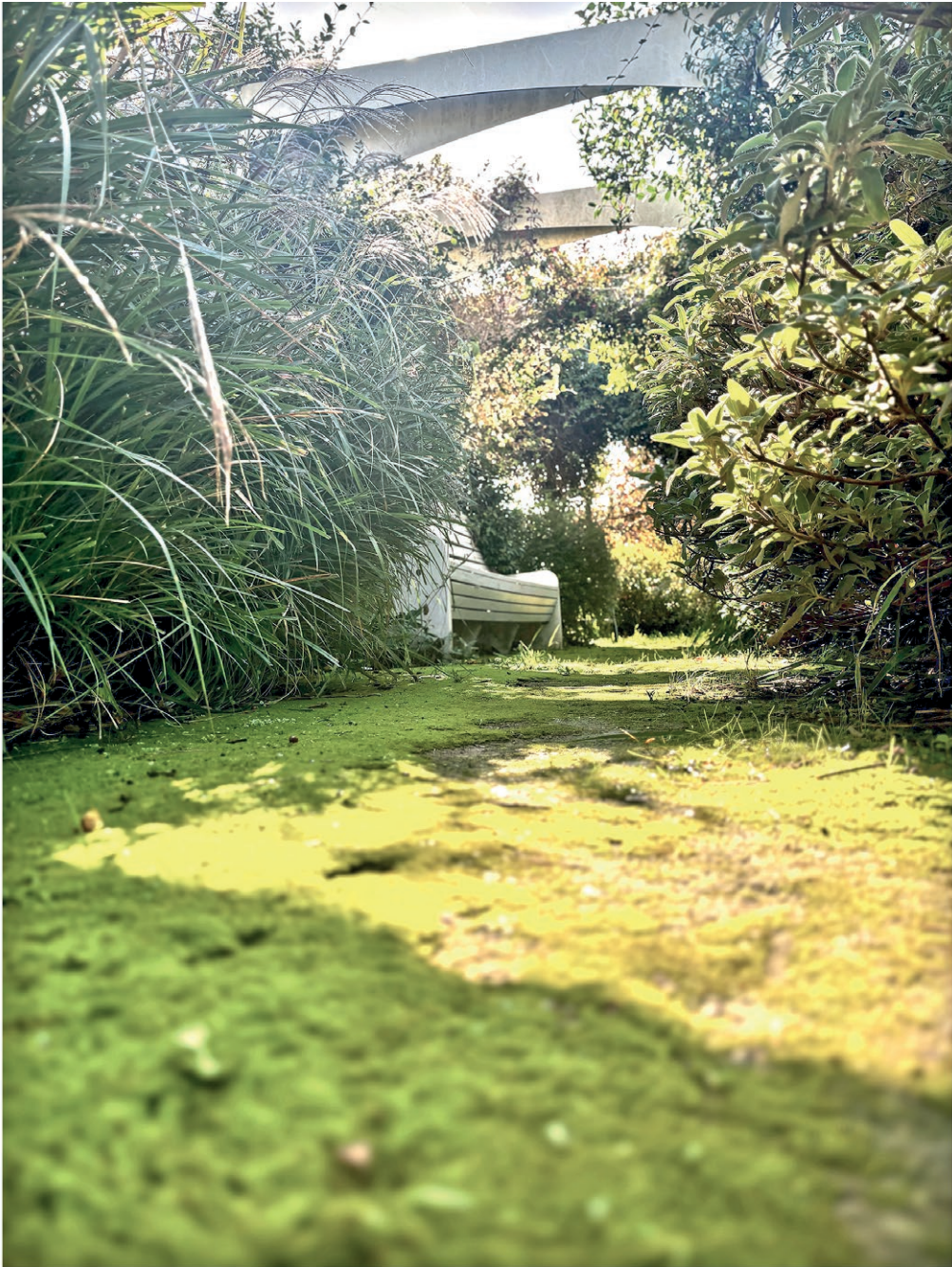
05 | Giardino terapeutico – Luigi Vessella, 2024

Vivaio Mati 1909, Pistoia. Un giardino terapeutico per il trattamento dell'Alzheimer. Un esempio di come la natura possa dare beneficio anche in un ambiente urbano transcendendo i vantaggi ambientali