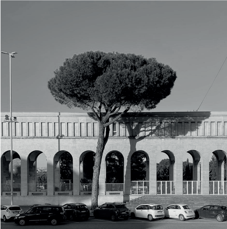
06 | Verde metafisico. Giovanni Manfolini, 2024. Roma Metaphysical green – Giovanni Manfolini, 2024. Rome