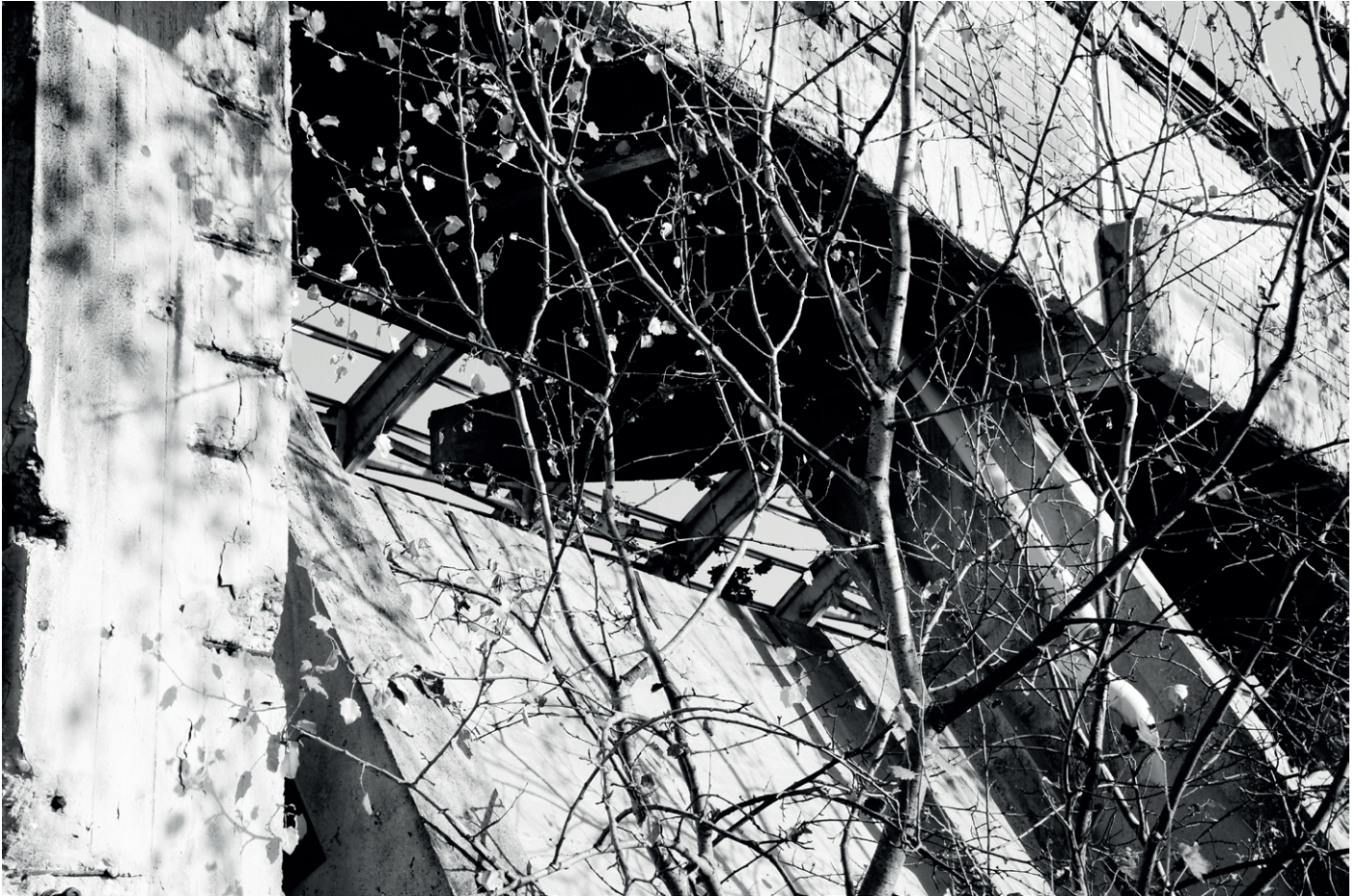
08 | Riappropriazioni – Irene Peron, 2024 Presidio industriale in abbandono invaso da vegetazione spontanea: dettaglio delle campate della struttura. Porto Marghera, Venezia. Area Complessi, Canale Industriale nord Reappropriations – Irene Peron, 2024 Abandoned industrial complex overgrown by spontaneous vegetation: detail of the structures. Porto Marghera, Venice. Complessi Area, North Industrial Canal