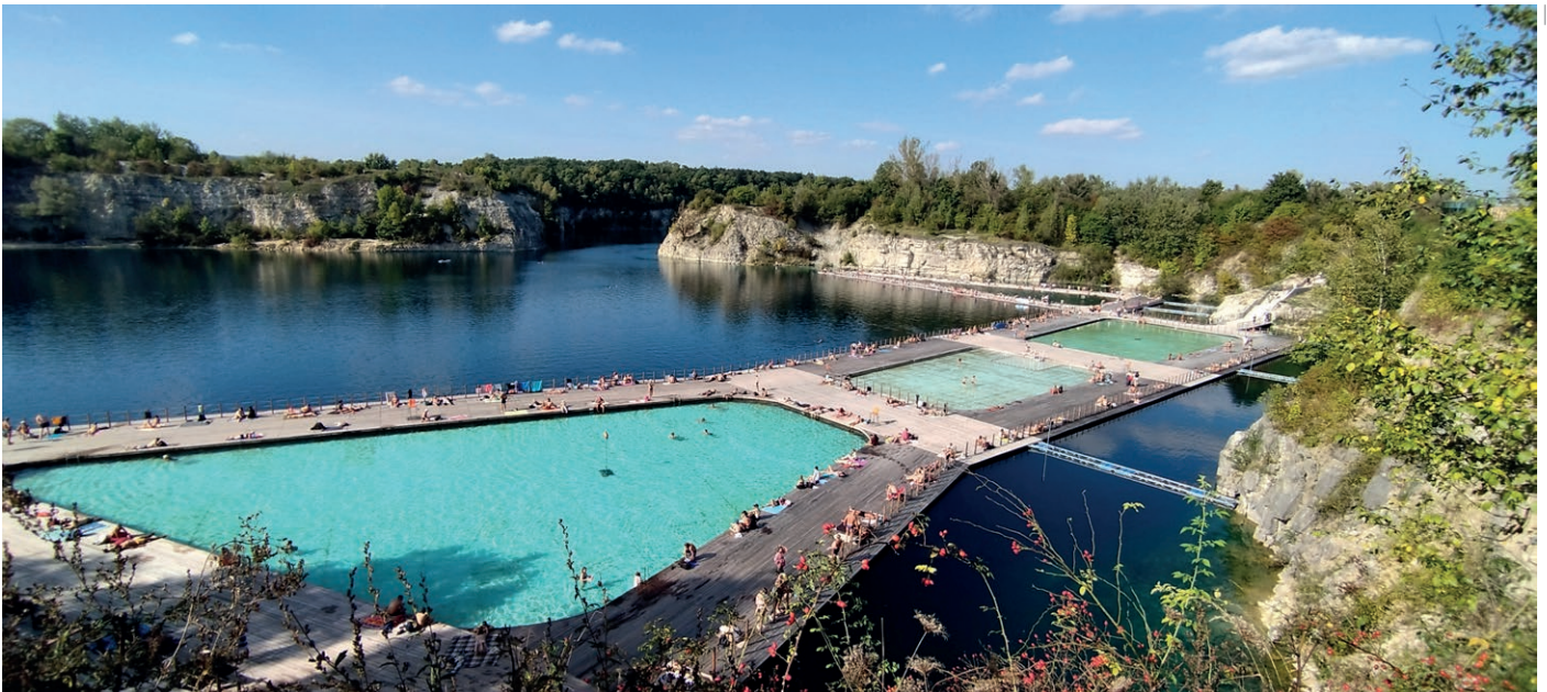
07 | Parco e piscina Zakrzówek, Cracovia, Polonia – Elena Dziopak 2024 Bacino artificiale quasi nel centro di Cracovia, creato dopo l'allagamento di una vecchia cava di calcare e dopo la rivitalizzazione trasformato in un parco paesaggistico unico di oltre 50 ettari Zakrzówek park and swimming pool, Krakow, Poland – Elena Dziopak 2024 Artificial reservoir almost in the Krakow 's centre, created after flooding an old limestone quarry and after revitalisation transformed into unique landscape park of over 50 hectares