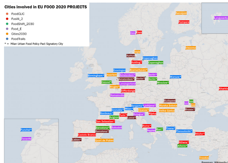
Figura 1: Le città coinvolte nei 6 progetti considerati