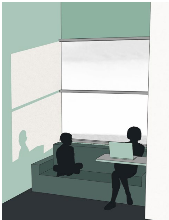
Figura 2. Esempificazione grafica dell'uso della family-zone.