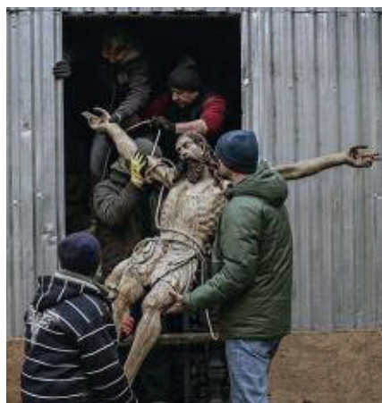
Fig. 6 La statua del Cristo della cattedrale armena di Leopoli mentre viene trasportata in un luogo sicuro per sfuggire alle bombe, marzo 2022.

Al di là della protezione immediata dei beni mobili e immobili del Patrimonio durante un conflitto, azione che in questi mesi abbiamo visto esprimersi in molti modi in Ucraina, dal trasporto in luogo sicuro del Cristo di Leopoli (fig. 6), alla protezione