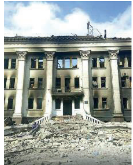
Fig. 2 I danni subiti dal teatro di Mariupol durante l'attuale conflitto in Ucraina, bombardato il 16 marzo 2022.

Il tentativo che la Convenzione persegue per una maggiore protezione di alcuni beni è il regime della "Protezione Speciale", accordato a quei beni 3 che presentino determinate condizioni. Tali sono, secondo l'art. 8, "a) che essi si trovino ad una distanza sufficiente da un grande centro industriale e da qualsiasi obiettivo che costituisca un punto sensibile, quale, ad esempio, un aeroporto, una stazione ferroviaria di una certa importanza o una strada di grande comunicazione; b) che essi non siano usati ai fini militari." Stando a tali prescrizioni, dunque, si comprende come l'iscrizione al "Registro internazionale dei beni culturali sotto protezione speciale" risulti poco praticabile, dal momento che, soprattutto nel nostro Paese, sono numerosi i beni monumentali che vengono utilizzati, anche solo parzialmente, per fini militari: si pensi, ad esempio alla Reggia di Caserta, all'interno della quale è inserita la Scuola Allievi Sottufficiali dell'Aeronautica militare o al Castello Maniace di Siracusa, che presenta nelle immediate vicinanze una sede dell'Esercito Italiano, solo per citarne due. Inoltre, relativamente all'iter di iscrizione, questo prevede procedure complesse che hanno reso quasi inefficace il sistema, con attualmente solo 18 beni mondiali iscritti.