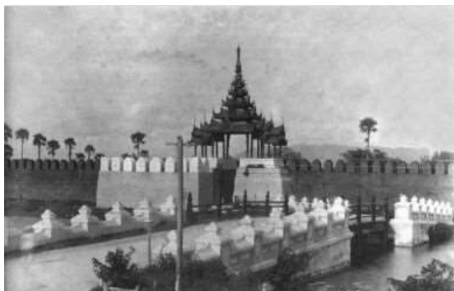
Ingresso del Palazzo di Mandalay nel 1855-1925

Immagine di copertina: il Palazzo di Mandalay tre giorni dopo il terremoto del 31 marzo 2025