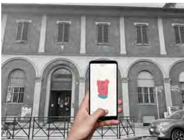
Figura 4 Esempio di rilievo speditivo di un fronte mediante fotocamera LiDAR e app.