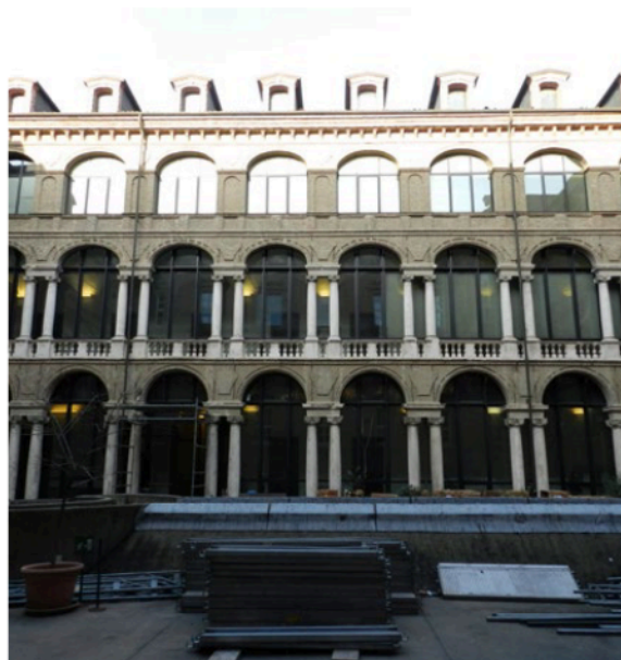
Figura 2. Torino, ex Antico Ospedale di San Giovanni, particolare dell'intervento di consolidamento del sistema di arcate che connotano il prospetto interno della manica principale.

attiene poi all'operatività sull'esistente, Gazzola e Pane raccomandano di «tener costantemente presente la più assoluta discrezione come premessa per qualsiasi intervento» 11 , ribadendo l'«esigenza di rigoroso rispetto per l'autenticità storica del monumento» 12 . Il restauro deve essere orientato alla massima salvaguardia dei beni nella loro stratificazione storica, garantendo la distinguibilità delle reintegrazioni e/o integrazioni che si rendessero necessarie 13 .