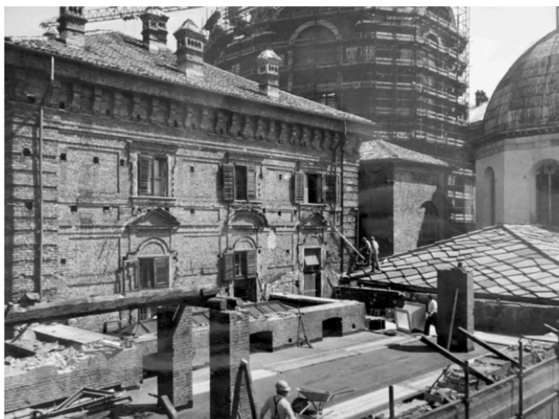
Figura 5. Torino, Palazzo Reale – Manica Nuova, intervento di smantellamento della copertura addossata a Palazzo Reale e al Duomo (SABAP-TO, SBAP-PIE, Torino: Palazzo Reale – Manica Nuova , TO/582/8. Sun concessione del MIC).

rientra in una delle più felici situazioni di adattabilità che possano presentarsi a chi ha il compito e la responsabilità di utilizzare preesistenze architettoniche per usi diversi da quelli originariamente pensati 27 ,