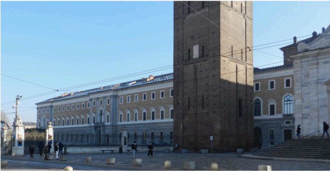
Figura 4. Torino, Palazzo Reale – Manica Nuova, prospetto esterno.

ingresso 23 , delle murature perimetrali, degli orizzontamenti 24 e del sistema di arcate che connotano il prospetto interno della manica principale 25 (Figura 2) ; (III) al parziale rifacimento della copertura per la quale sono state adottate strutture in legno lamellare (Figura 3). Inoltre, le difficoltà riscontrate nell'individuare una adeguata localizzazione per alcuni servizi indispensabili alla nuova destinazione d'uso e la volontà di non compromettere la qualità dell'architettura su cui erano chiamati ad operare hanno spinto i progettisti a proporre la costruzione di nuovi volumi sotterranei che, realizzati in corrispondenza dei cortili interni 26 con struttura in calcestruzzo armato chiaramente distinguibile e rispettosa dell'allineamento dell'impianto planimetrico generale, ospitano sale per convegni, sale studio, depositi, laboratori di restauro, impianti tecnologici e servizi generali per il personale.