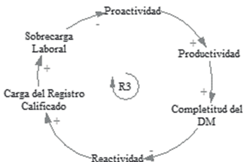
Figura 3. Ciclo de refuerzo entre proactividad, sobrecarga laboral y carga registro calificado.

En la figura 3 se observa el ciclo de refuerzo de la proactividad R3, que describe la relación de la completitud del documento maestro y la influencia de variables de reactividad y proactividad de los actores. Este muestra cómo la proactividad afecta la completitud del documento a la vez que ejerce una reactividad por parte de los actores e induce a una sobrecarga laboral.