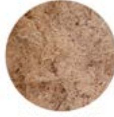
TONDELLO DI PIOPPO