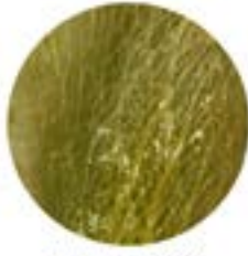
PALA FICO D'INDIA