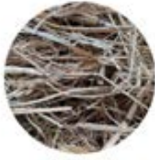
PAGLIA DI RISO