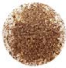
BARB. DA ZUCCHERO